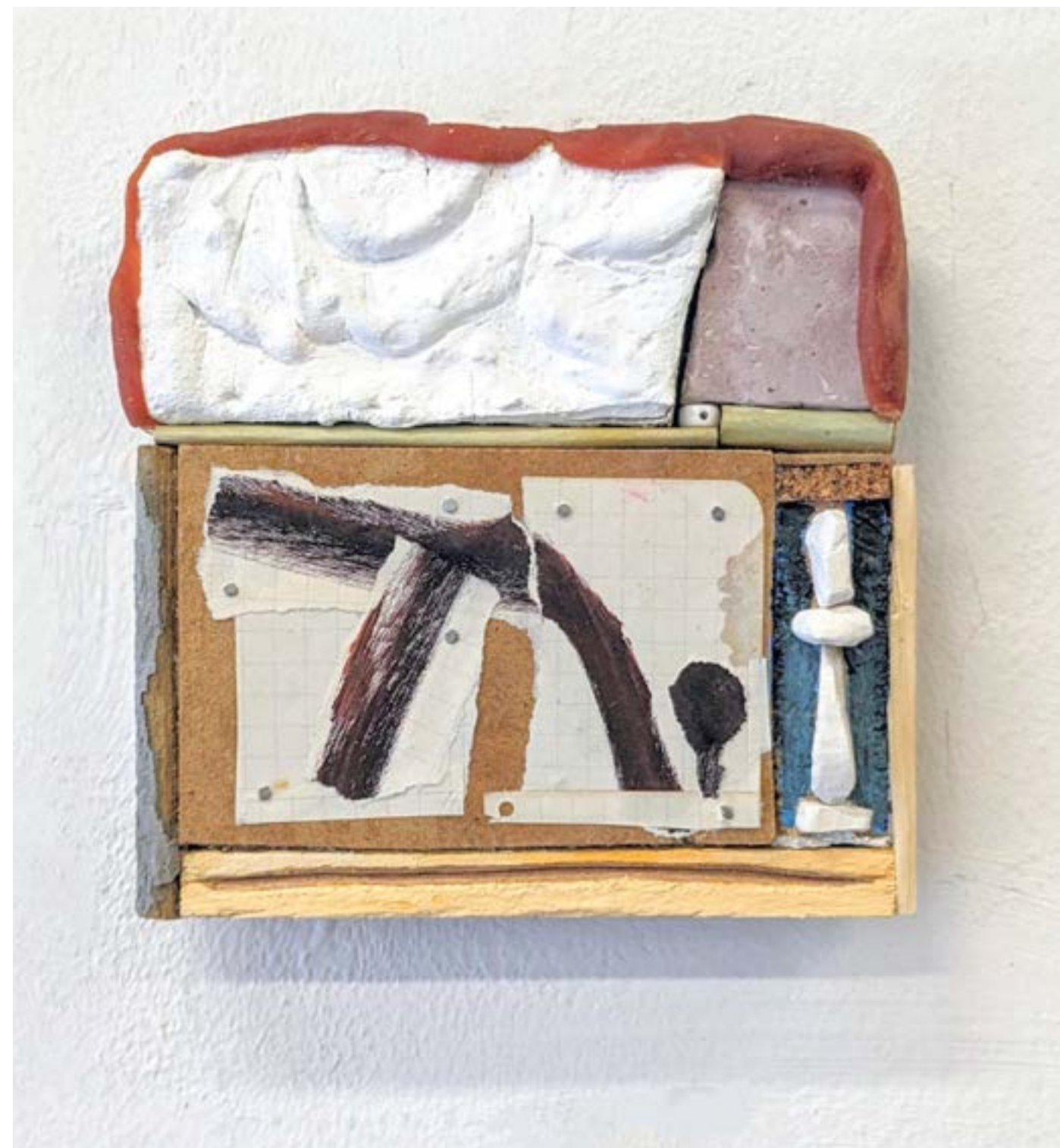
Gestalt opus incertum , 2024 plâtre, cire, papier, bois, pigment, acrylique, 12x12cm