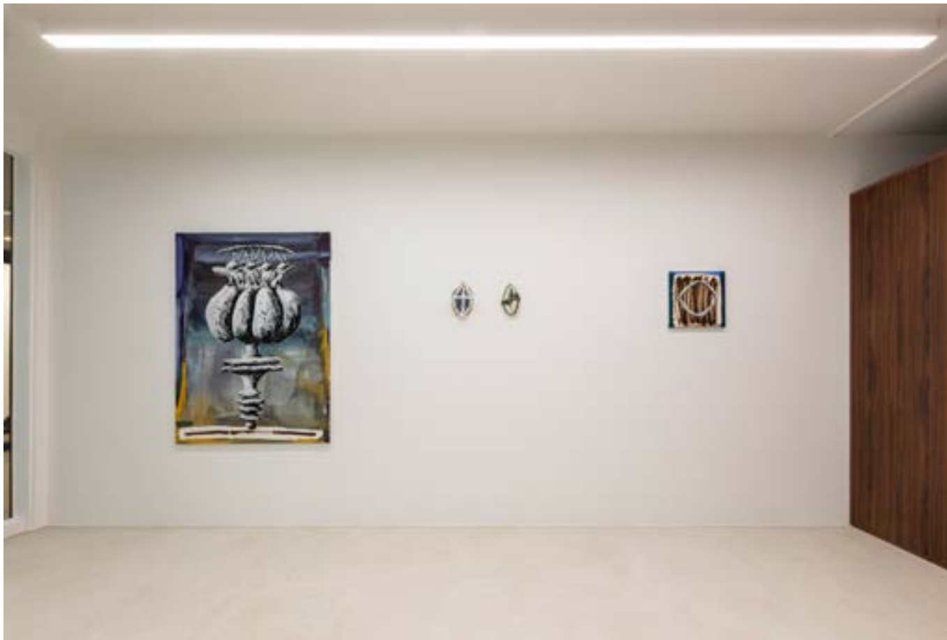
vue de Reburgaia sublunari, Galerie La peau de l'ours, 2023