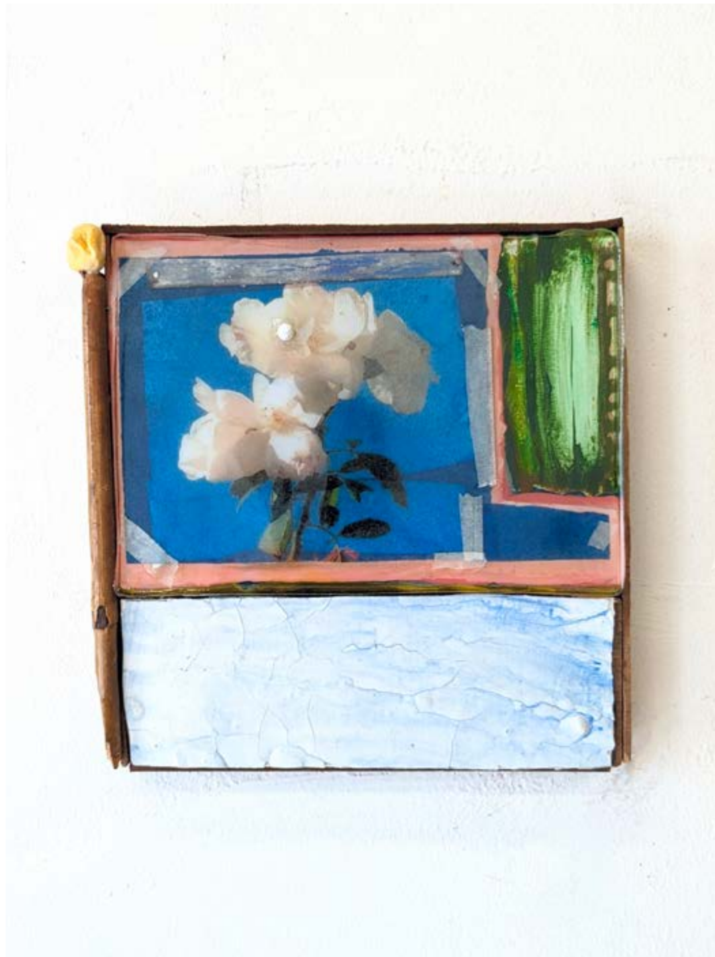
Gestalt 5, 2024 pigment, toile, photographie, papier, scotch, pâte à modeler, bois, 22x22cm