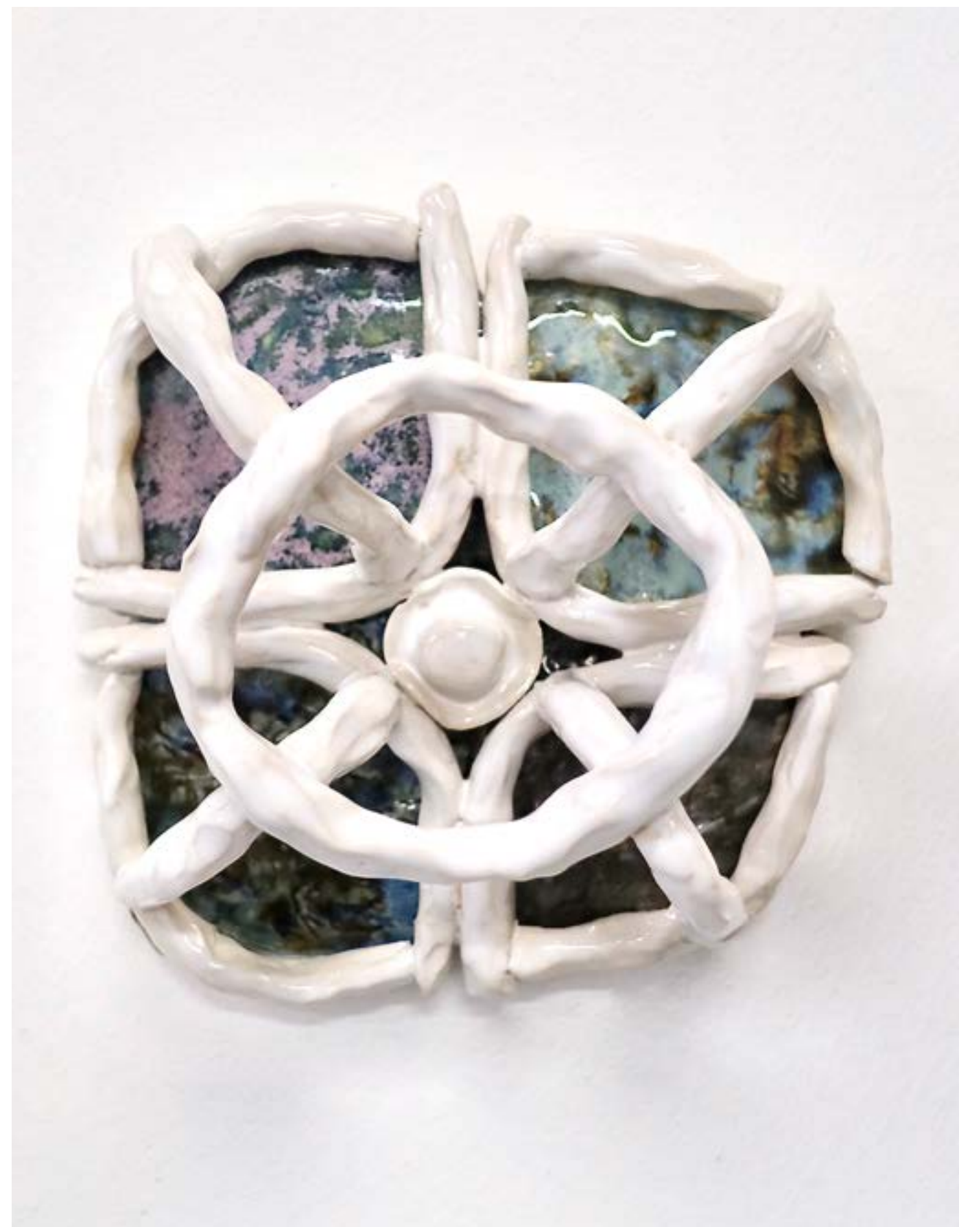
A la capo 3 (à l'ombre en cachette), 2023 céramique, 18x16x8cm