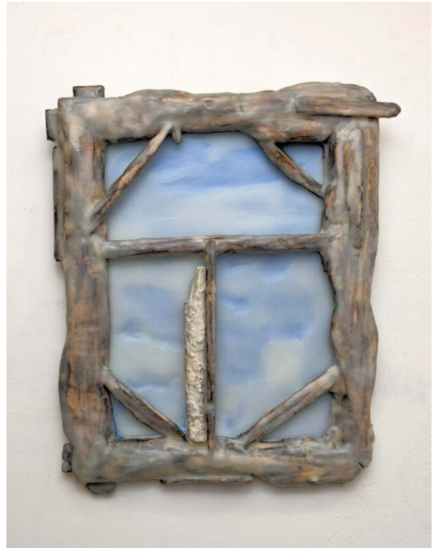
Ambiance poutargue dans la cabane, 2022 huile, acrylique, cire, bois sur bois, 29x25cm