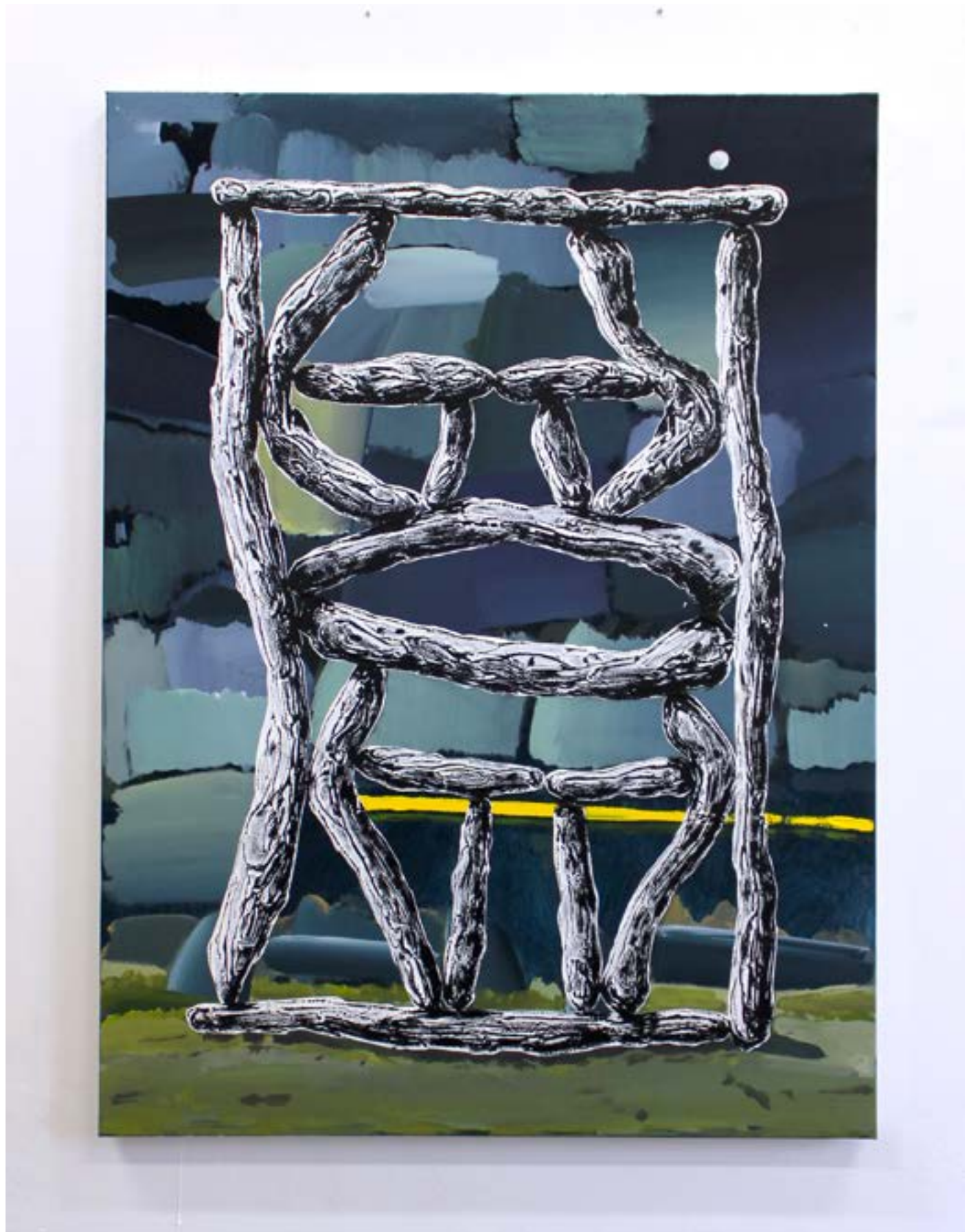
S'empalafica (s'asseoir avec fierté) , 2022 acrylique et huile sur toile, 81x60cm