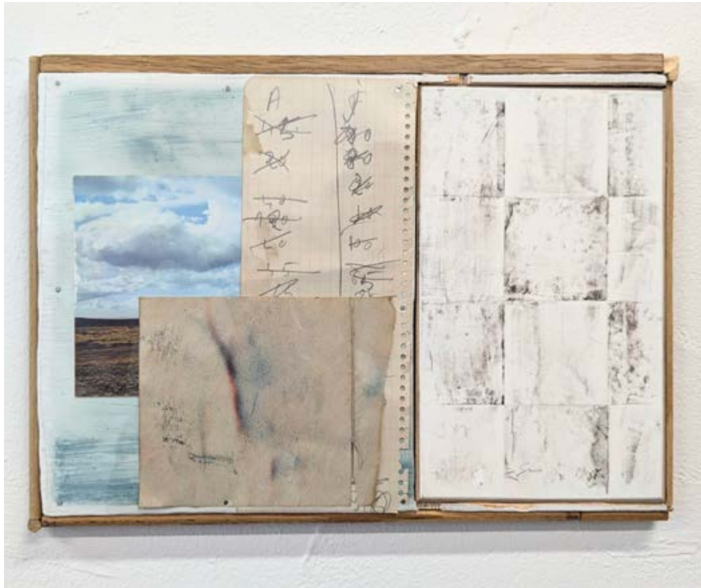
Gestalt 14 , 2024 bois, fusain, papier, encre, photographie, film pvc