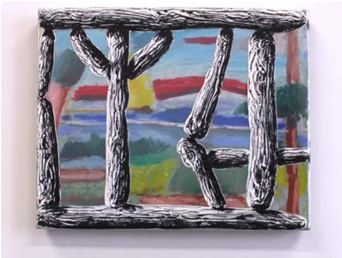
Ni lundi, ni aucun autre jours de la semaine, 2022 pastel sec, pastel gras, acrylique, huile, toile cirée transparente sur toile, 22x27cm