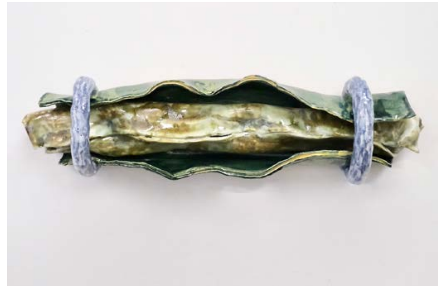
A la capo 4 , 2023, céramique, 20x40x8cm Estrachano 7 , 2023, céramique, 16x53x10cm