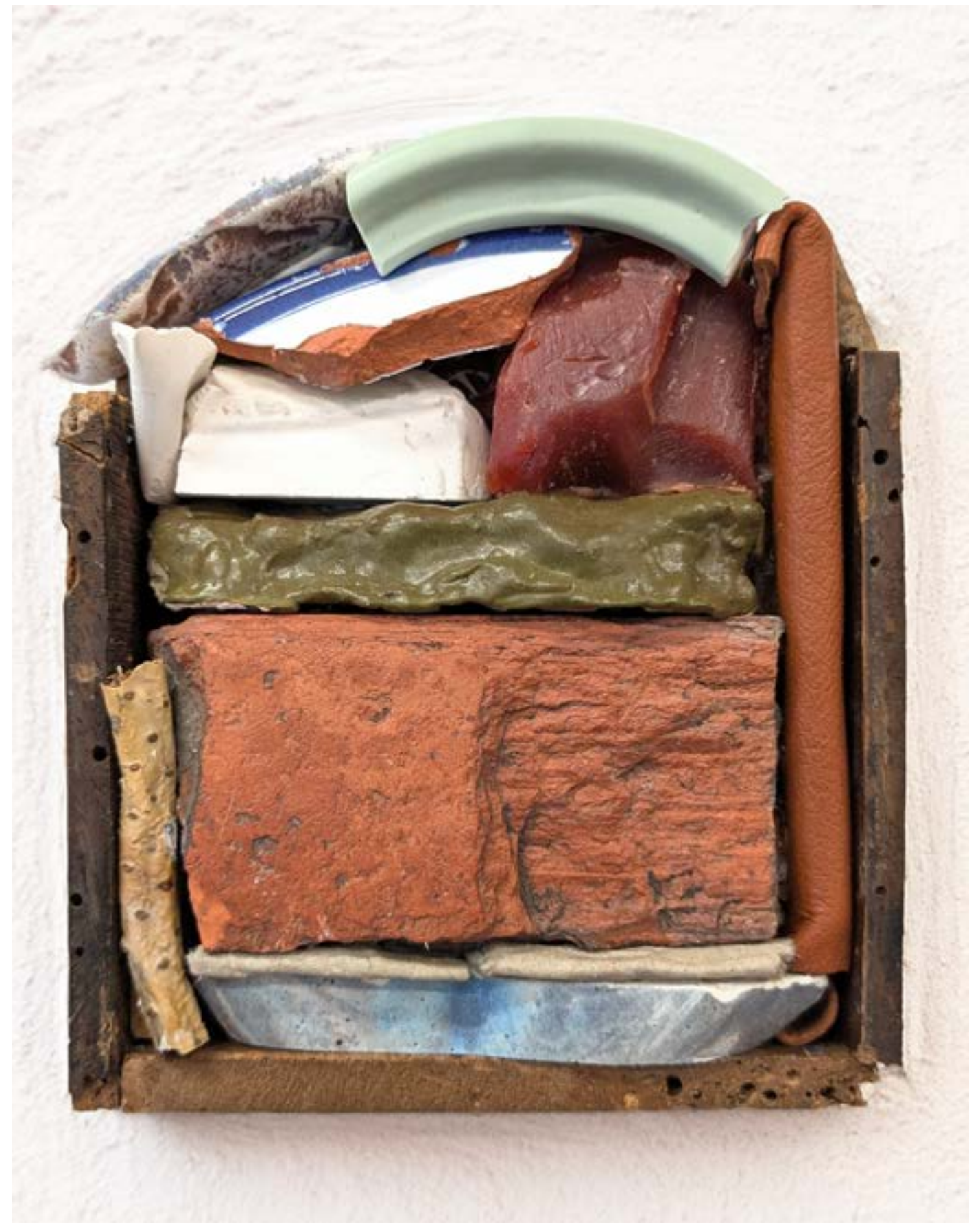
Gestalt 20 , 2024 bois, plâtre, céramique, cire, béton, pigment, cuir, végétaux, pâte à papier, 14x12cm