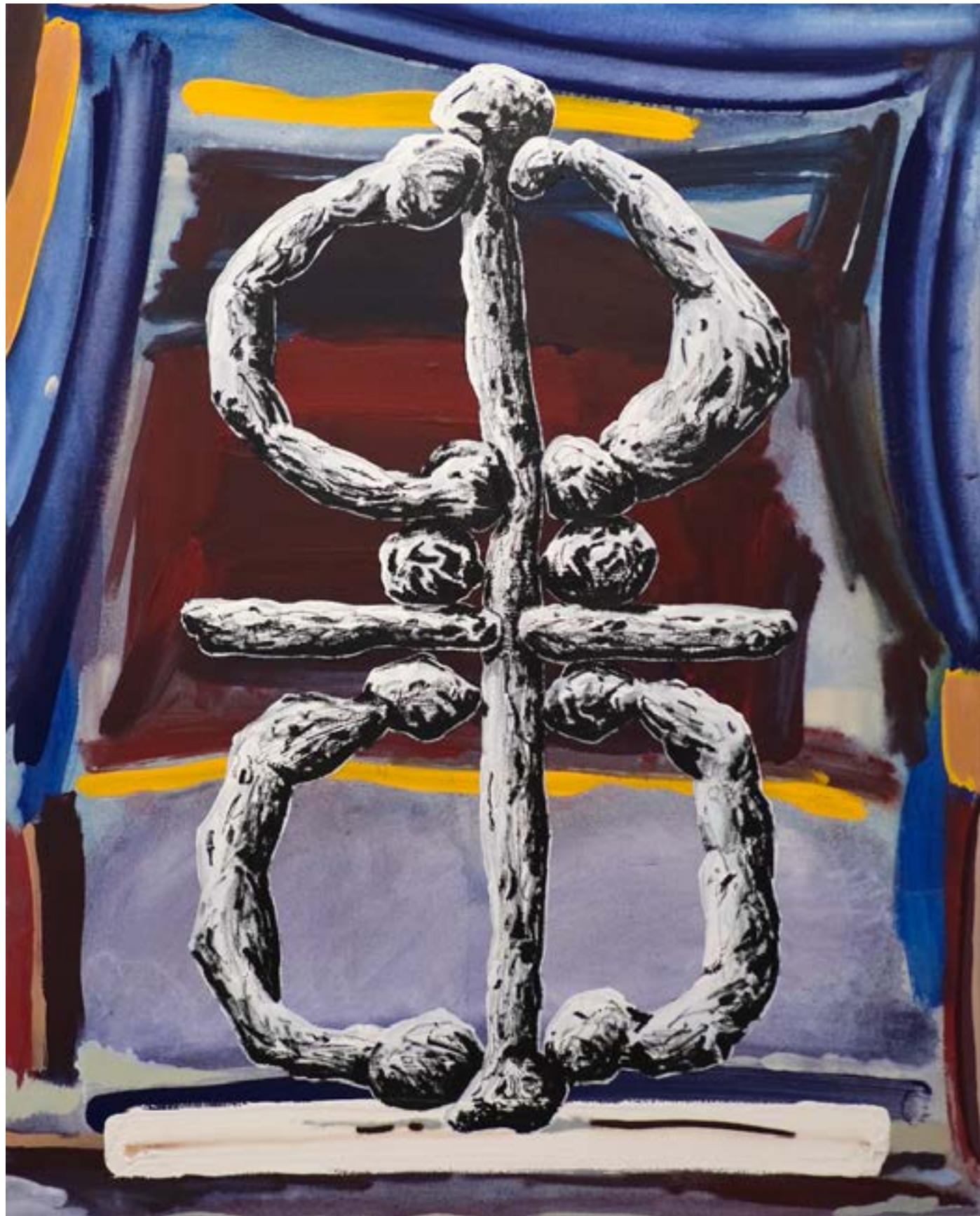
Ribeira (faire descendre du bois par une rivière), 2023 acrylique et huile sur toile, 146x114cm