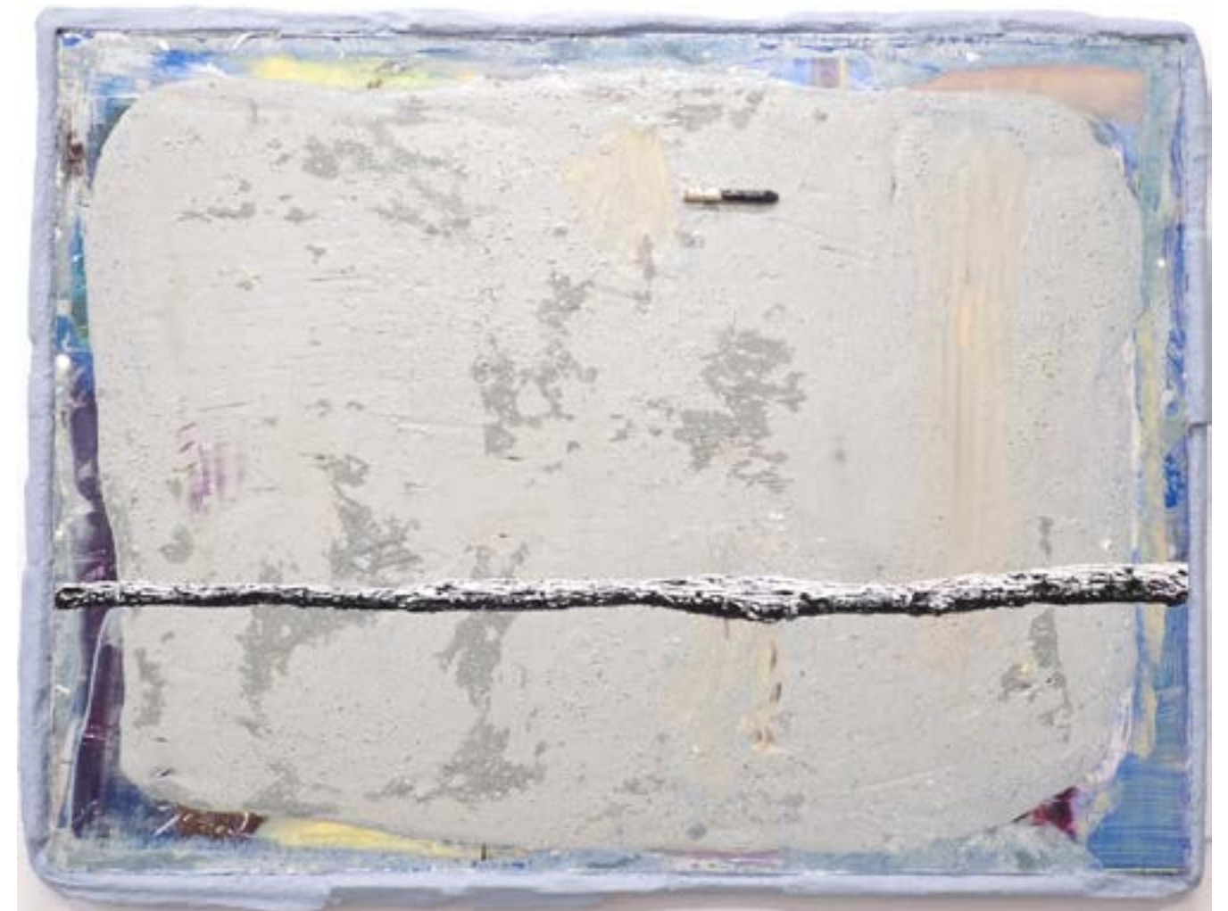
Asuèi (horizon), 2023 acrylique, plâtre, carton, bois et huile sur toile, 146x114cm