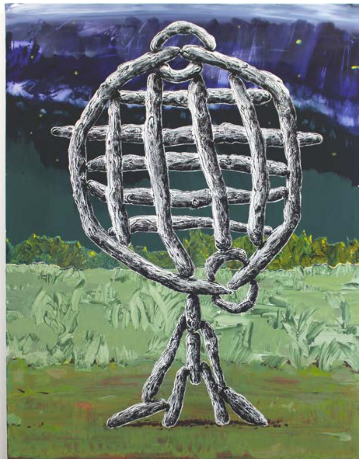
Coucho-mousco (l'attrape mouche), 2022 acrylique et huile sur toile, 146x114cm