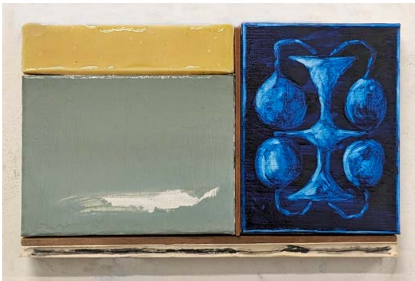
Gestalt 2, 2024 huile, cire, résine, bois, toile, fusain, plâtre 22x38cm