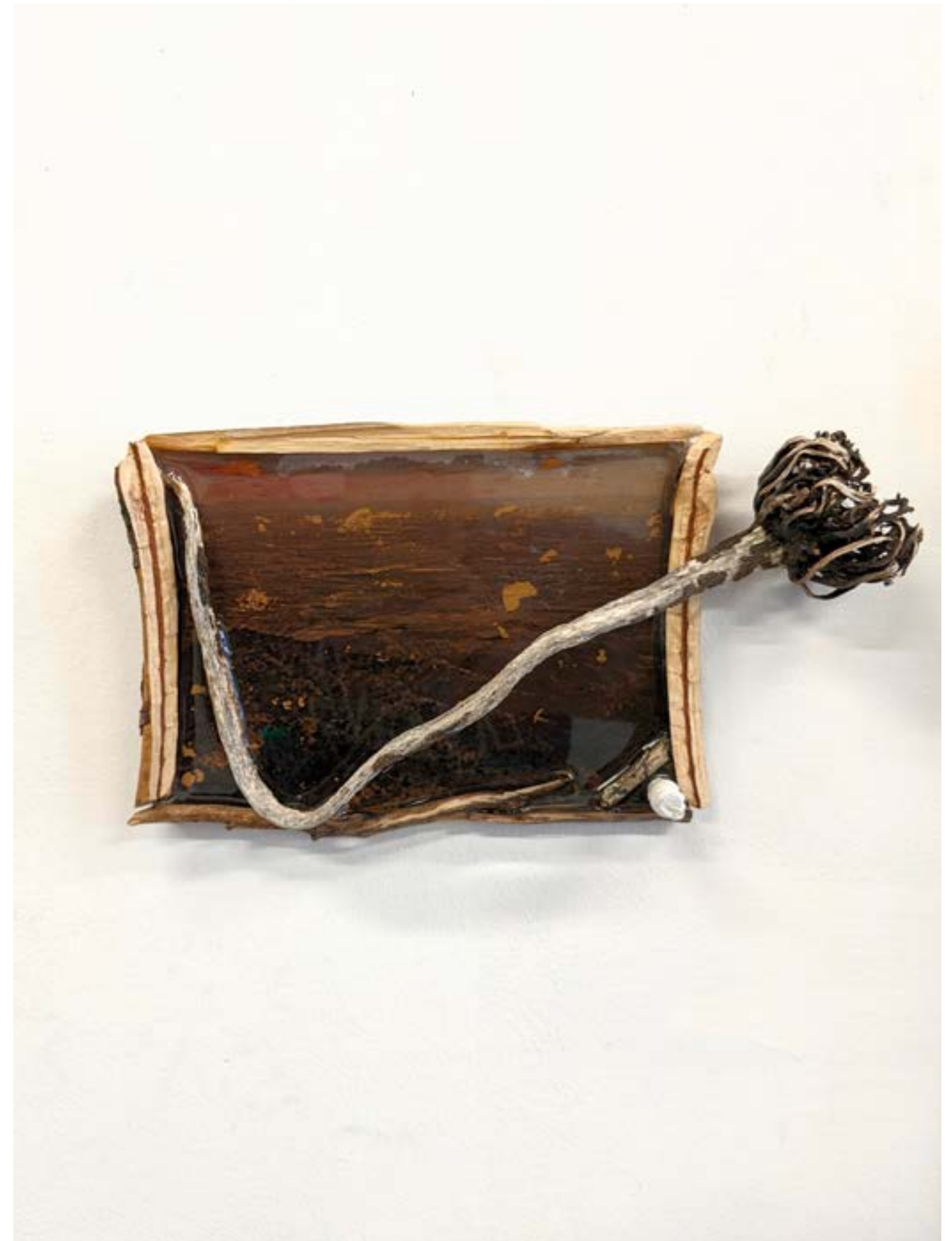
Tout-là-haut sans le bruit , 2022 impression laser, bois, acrylique, résine sur bois, 14x26cm