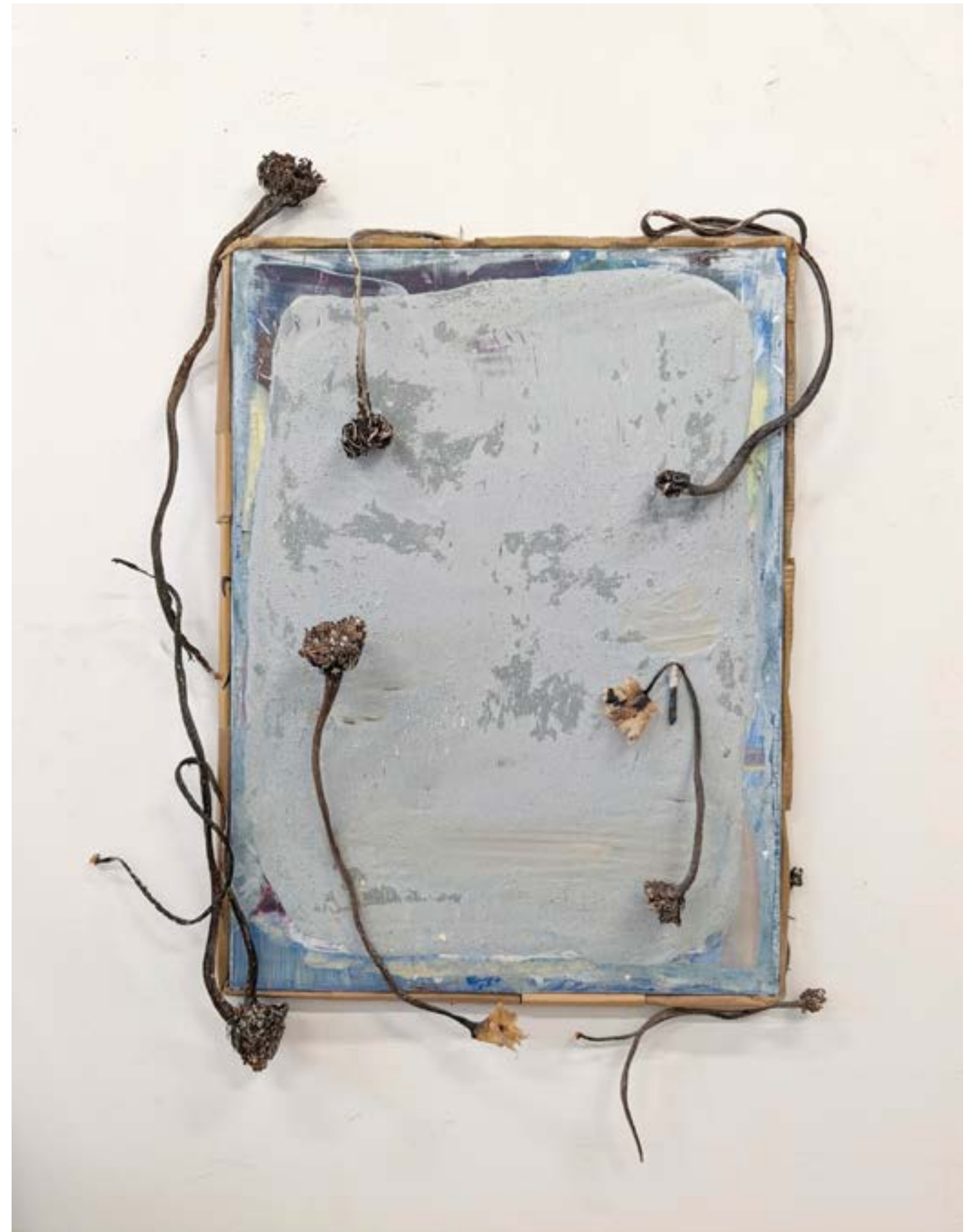
A marée basse , 2022 acrylique, plâtre, vernis, carton, bois et algues sur toile, 85x70cm