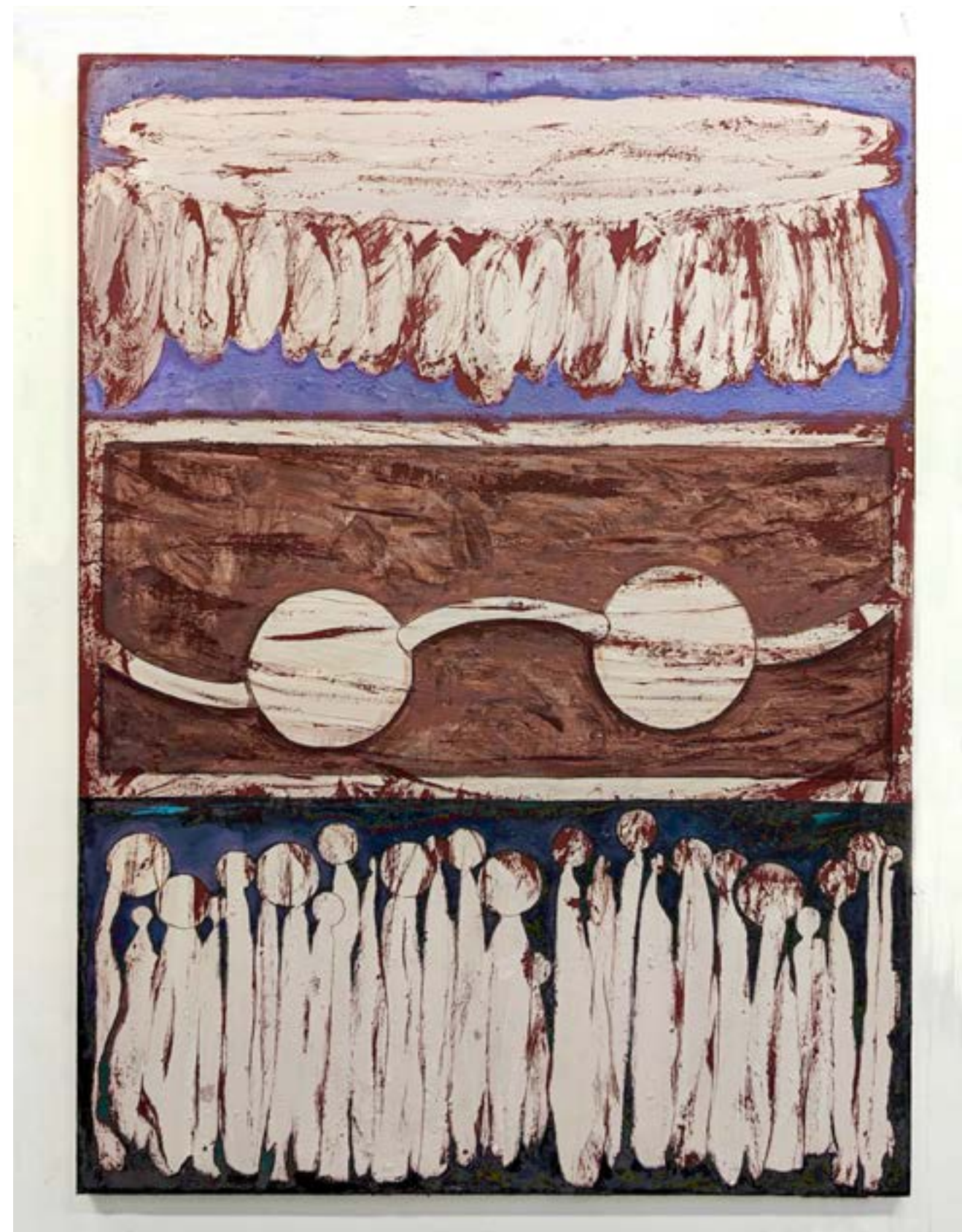
Entre moi et moi, une passerelle #2, 2023 huile et acrylique sur toile, 150x110cm