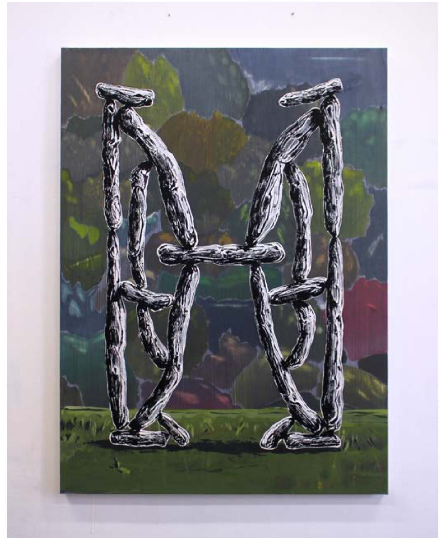
A bellei doues (Par deux) , 2022 acrylique et huile sur toile, 81x60cm