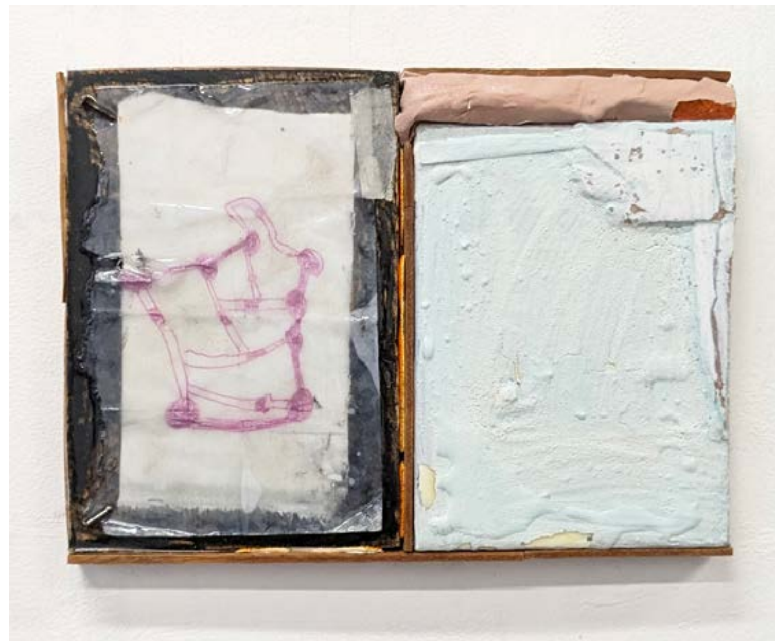
Gestalt 1, 2024 fusain, feutre, acrylique, pigment, plâtre, écorces d'orange, clous, résine, bois, toile 22x35cm