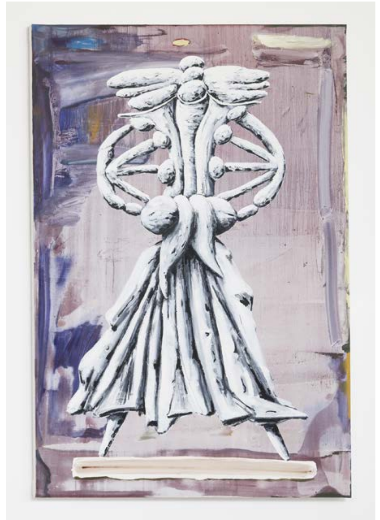
Esfloura (faire tomber les fleurs d'un arbre fruitier) 2023 acrylique et huile sur toile, 195x130cm