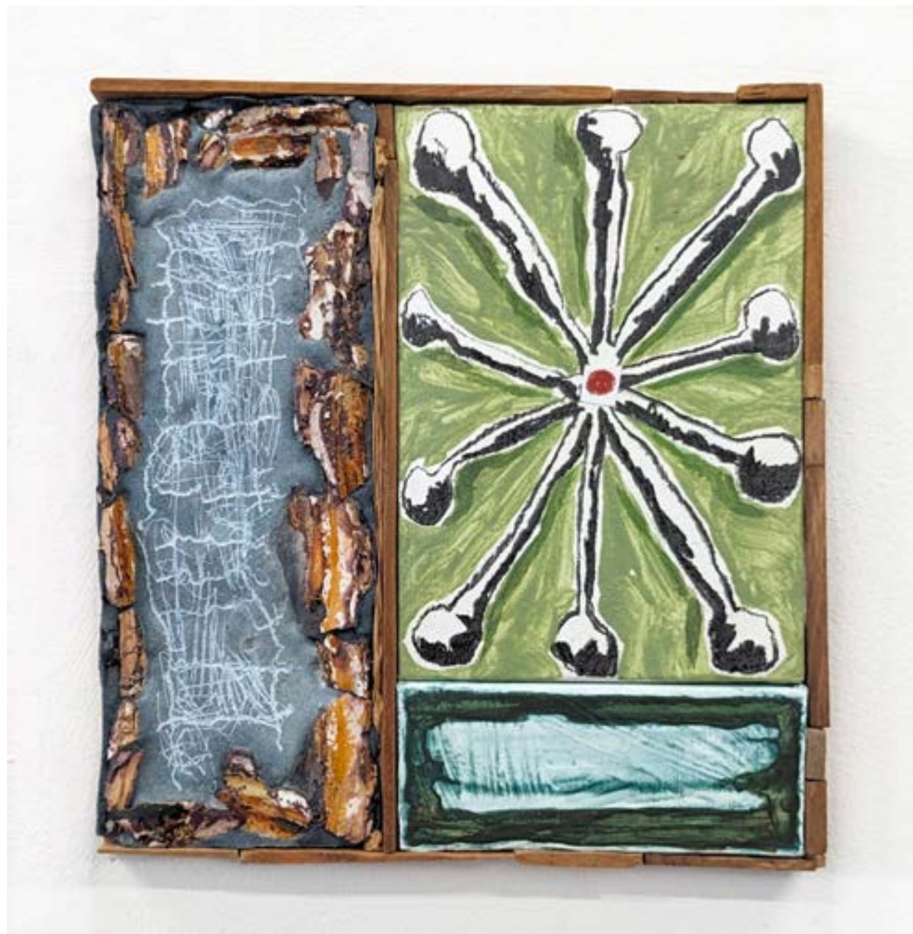
Gestalt 4, 2024 acrylique, pigment, fusain, plâtre, résine, bois, papier, toile 35x28cm