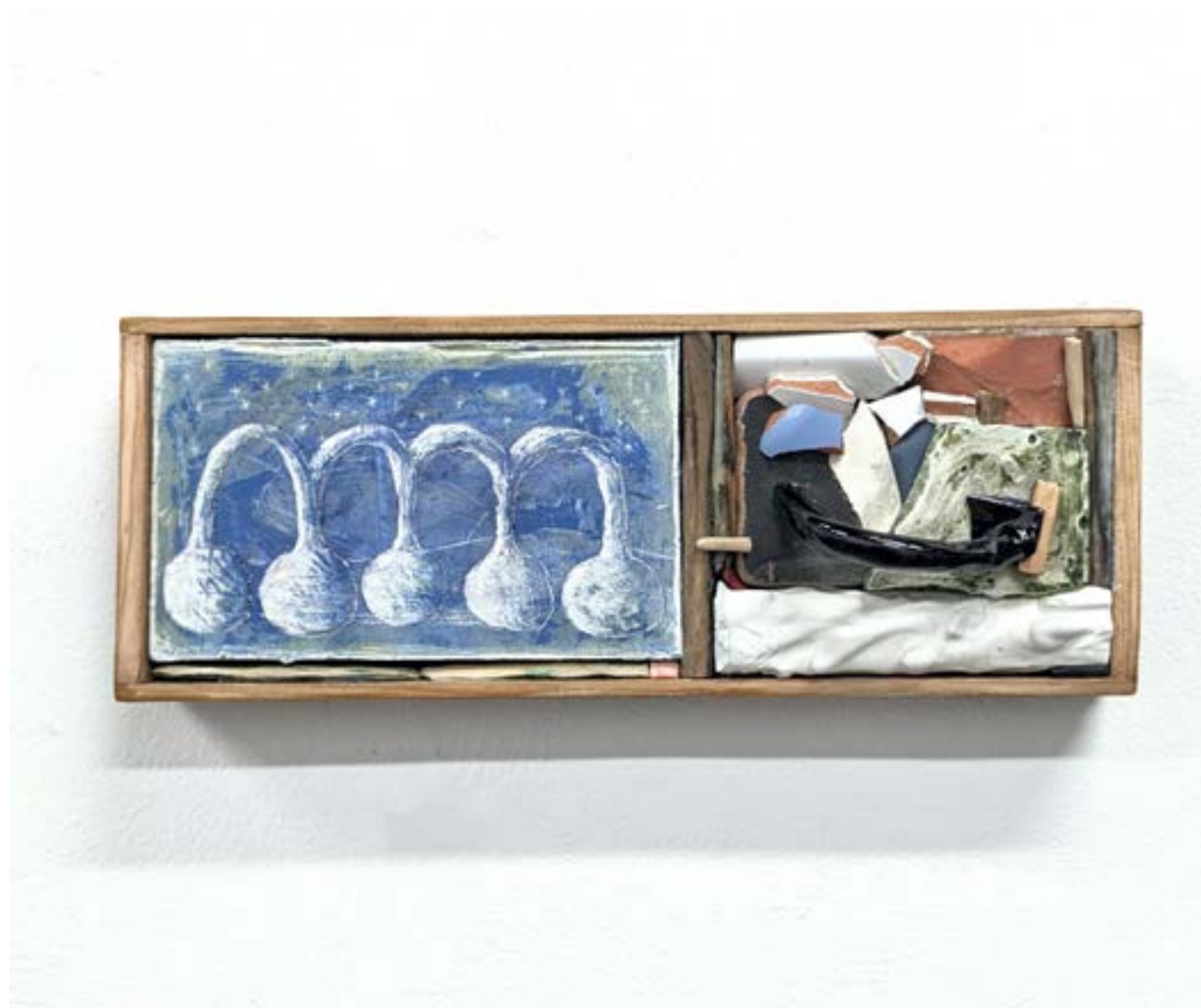
Gestalt 1, 2024 fusain, feutre, acrylique, pigment, plâtre, écorces d'orange, clous, résine, bois, toile 22x35cm