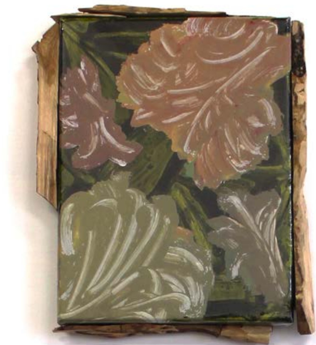
Agaracha (Laisser reposer une terre), 2022 acrylique, huile, bois, toile cirée transparente sur toile, 29x21cm