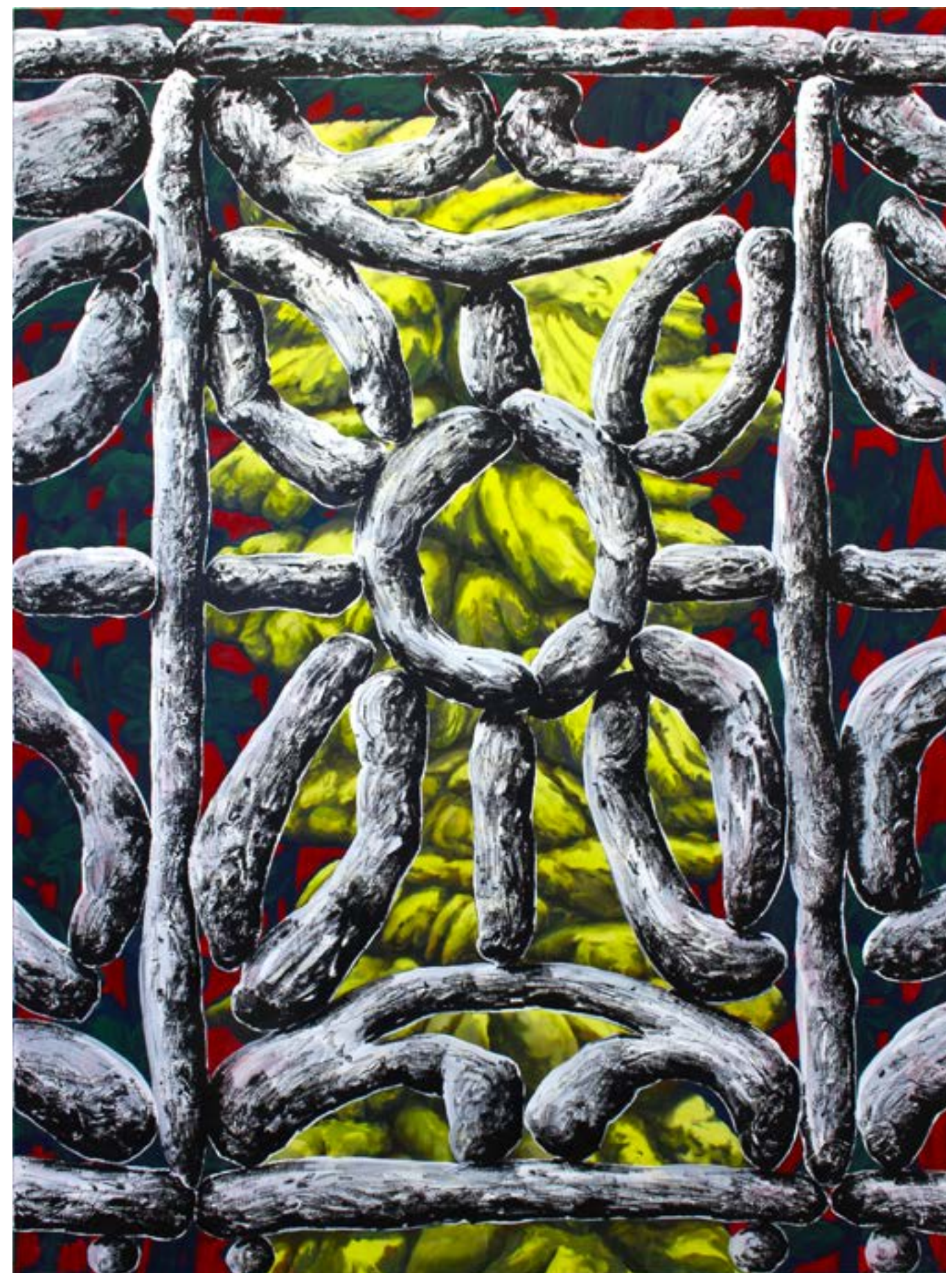
Duca duga (regarder sans parler), 2023 acrylique et huile sur toile, 146x114cm