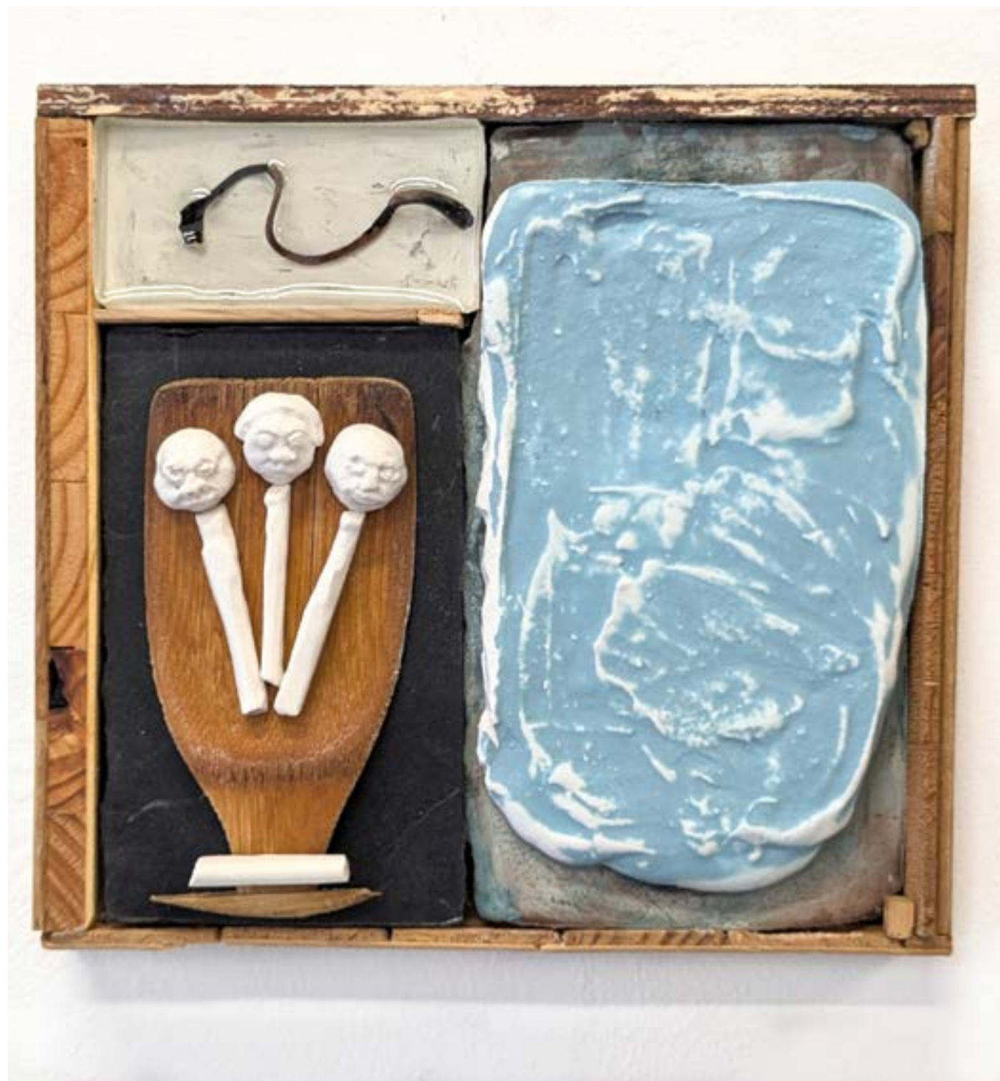
Gestalt 17 , 2024 résine, plâtre, pigment, bois, algue bretonne, 20x22cm