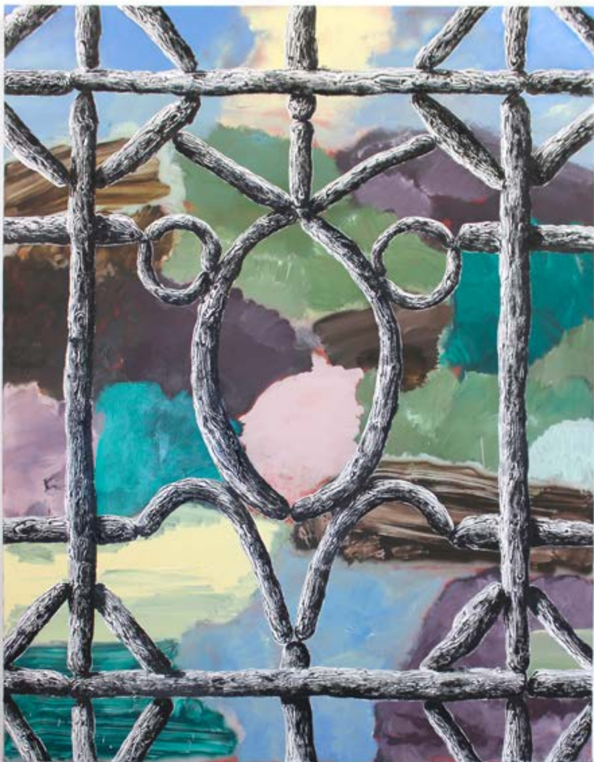
Gasai (le ramage des oiseaux), 2022 acrylique et huile sur toile, 146x114cm