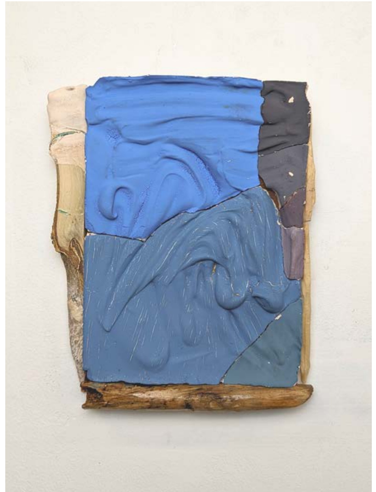
Egotoco (ombre qui s'avancant sur un rocher sert de montre solaire aux paysans), 2021, plâtre, bois, binder, gesso pigmenté sur panneau de bois, 24x19cm