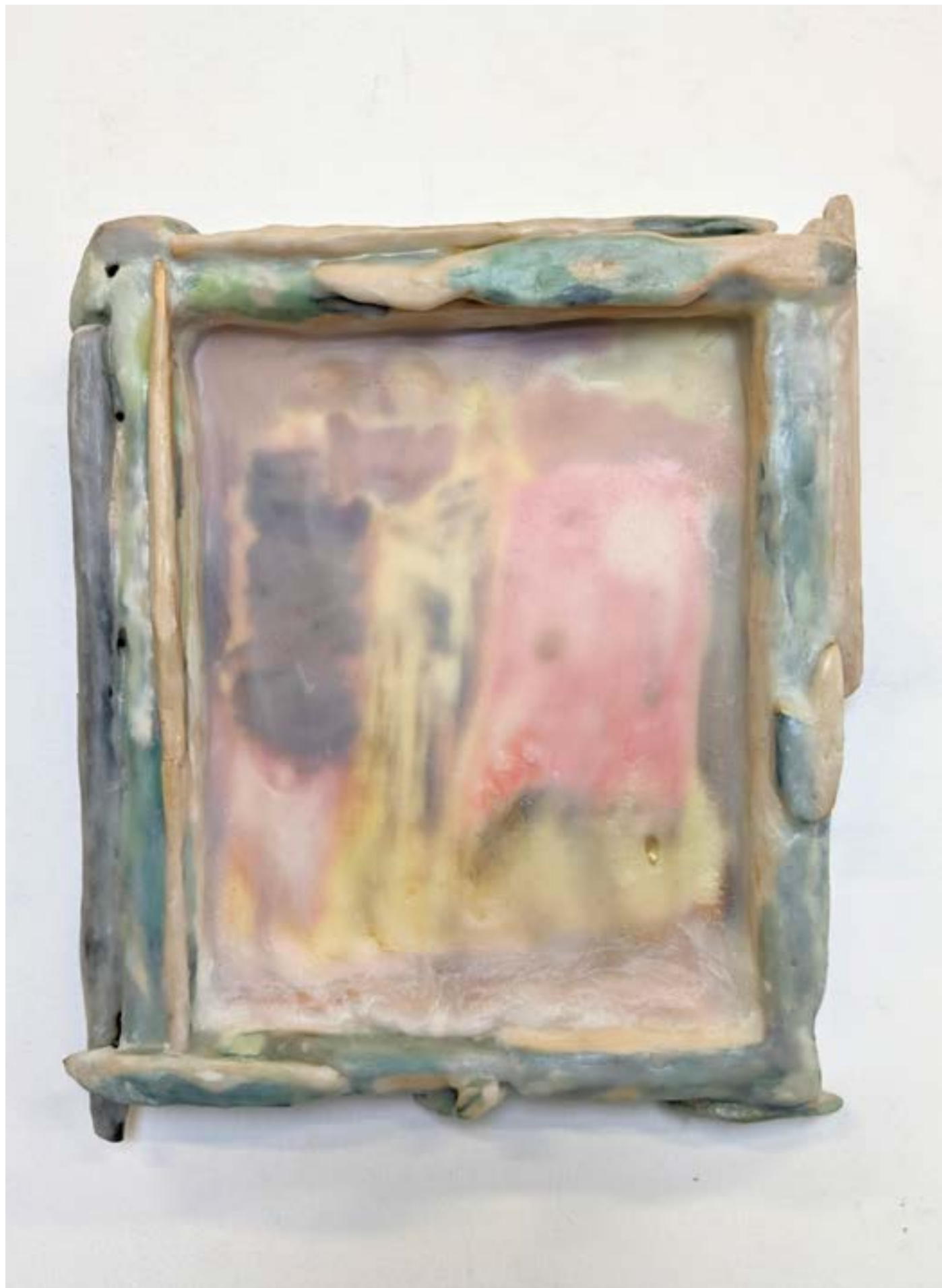
Mouine (cage en bois à l'intérieur de laquelle on pend un réchaud pour chauffer un lit), 2022, huile, acrylique, cire sur bois, 31x27cm