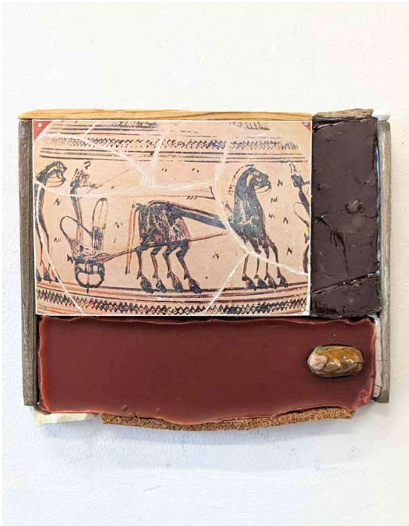
Gestalt 10 , 2024 cire, bois, pigment, céramique, carte postale, aspirine, clous, 17x20cm