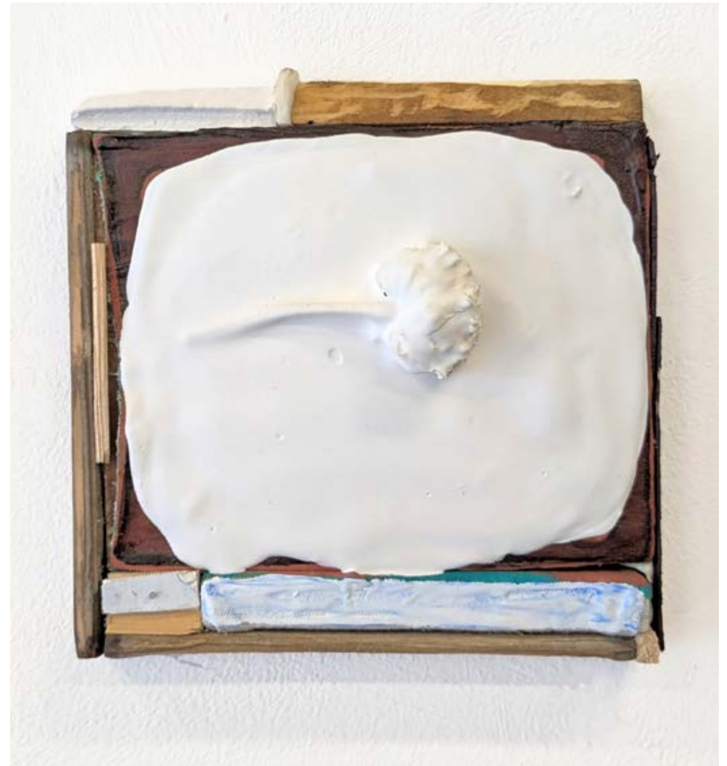
Gestalt 13 , 2024 bois, fleur séchée, pigment, gesso, toile, 17x17cm