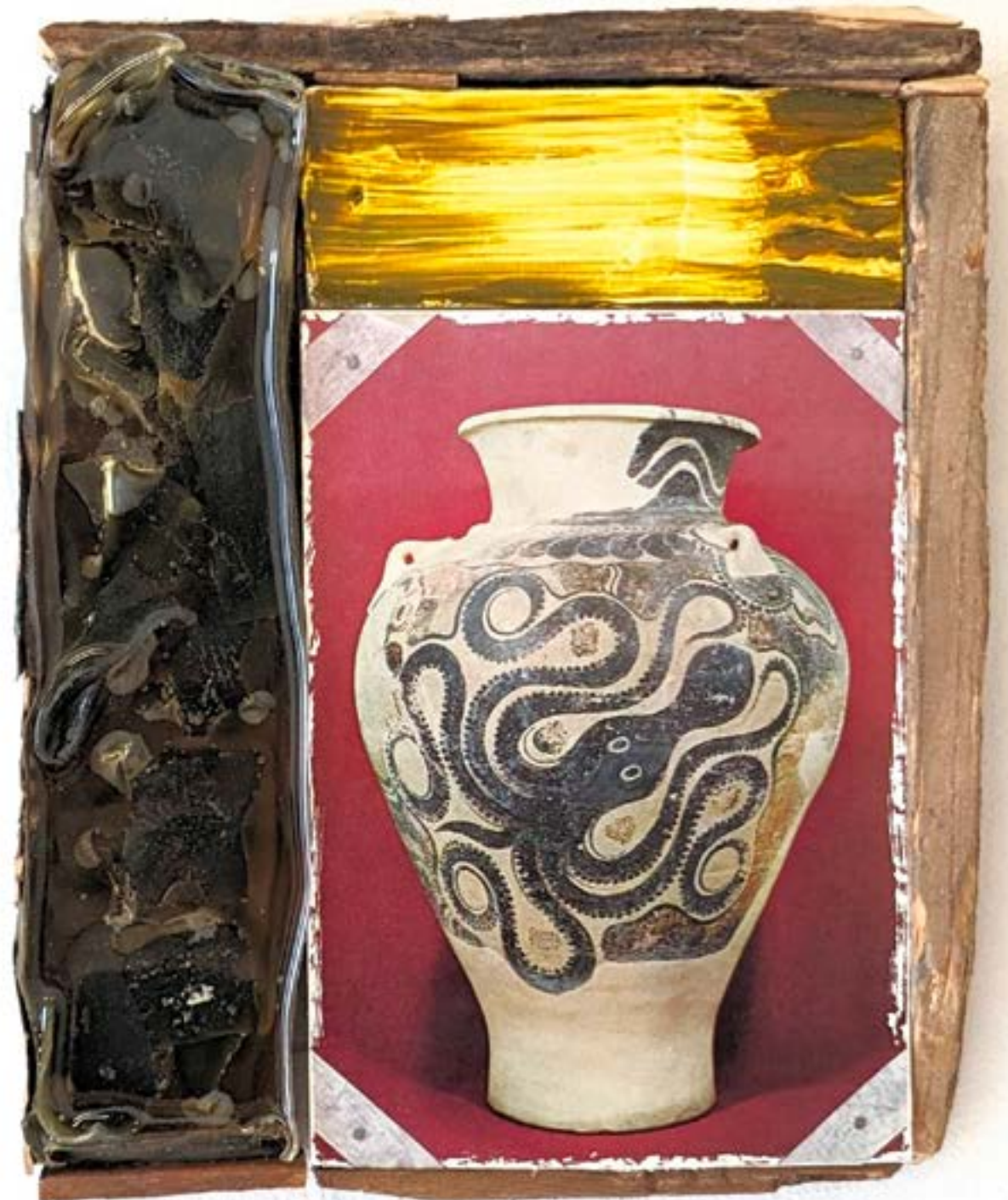
Gestalt 7, 2024 bois, huile, cire, résine, carte postale, 24x18cm