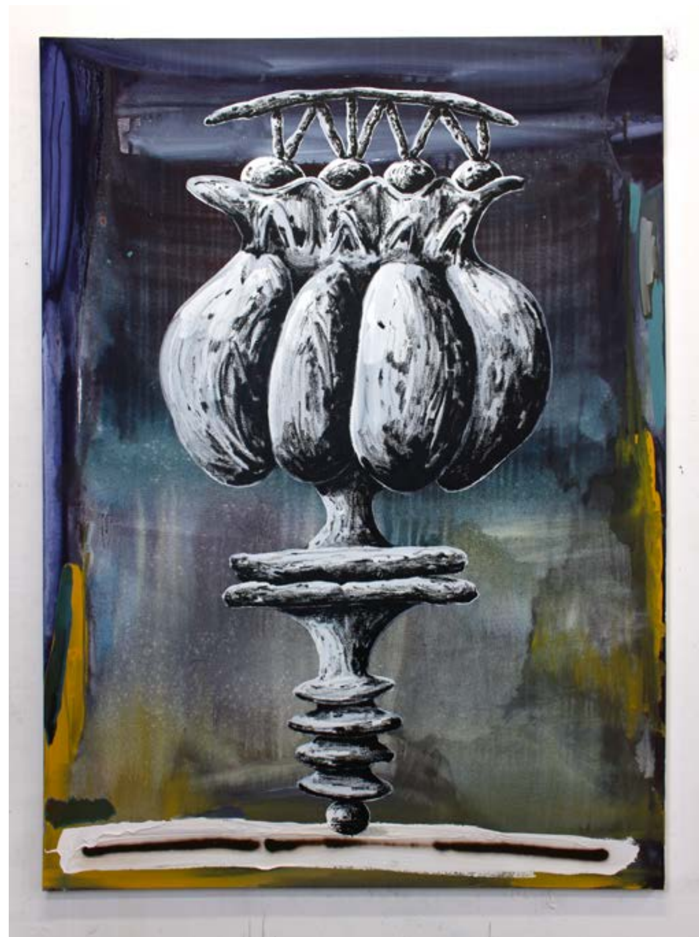
Peiroulet (bulles dues aux gouttes de pluies sur les flaques), 2023 acrylique et huile sur toile, 146x114cm