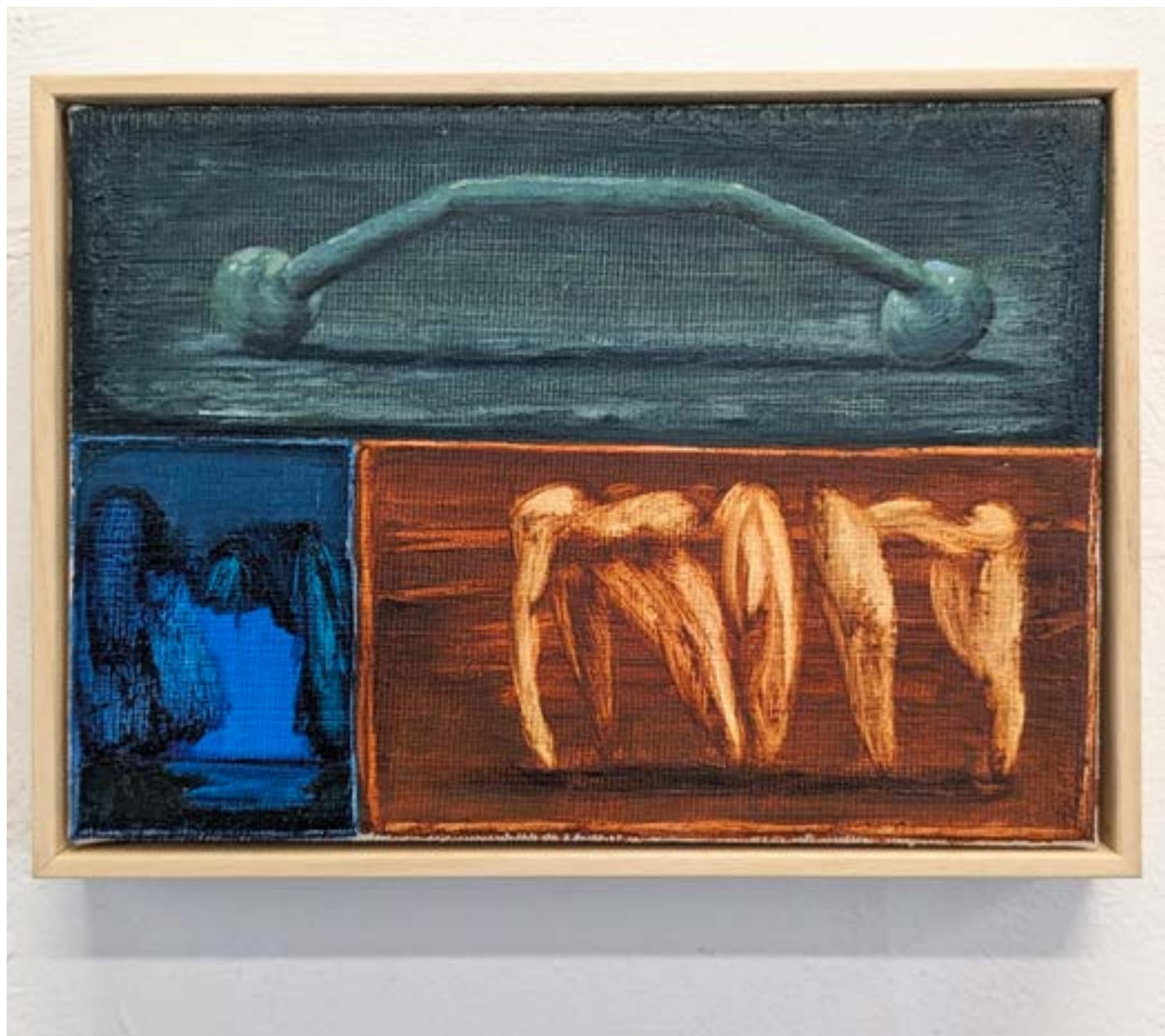
Songe-creux 9, 2023 huile sur toile, 15x20cm