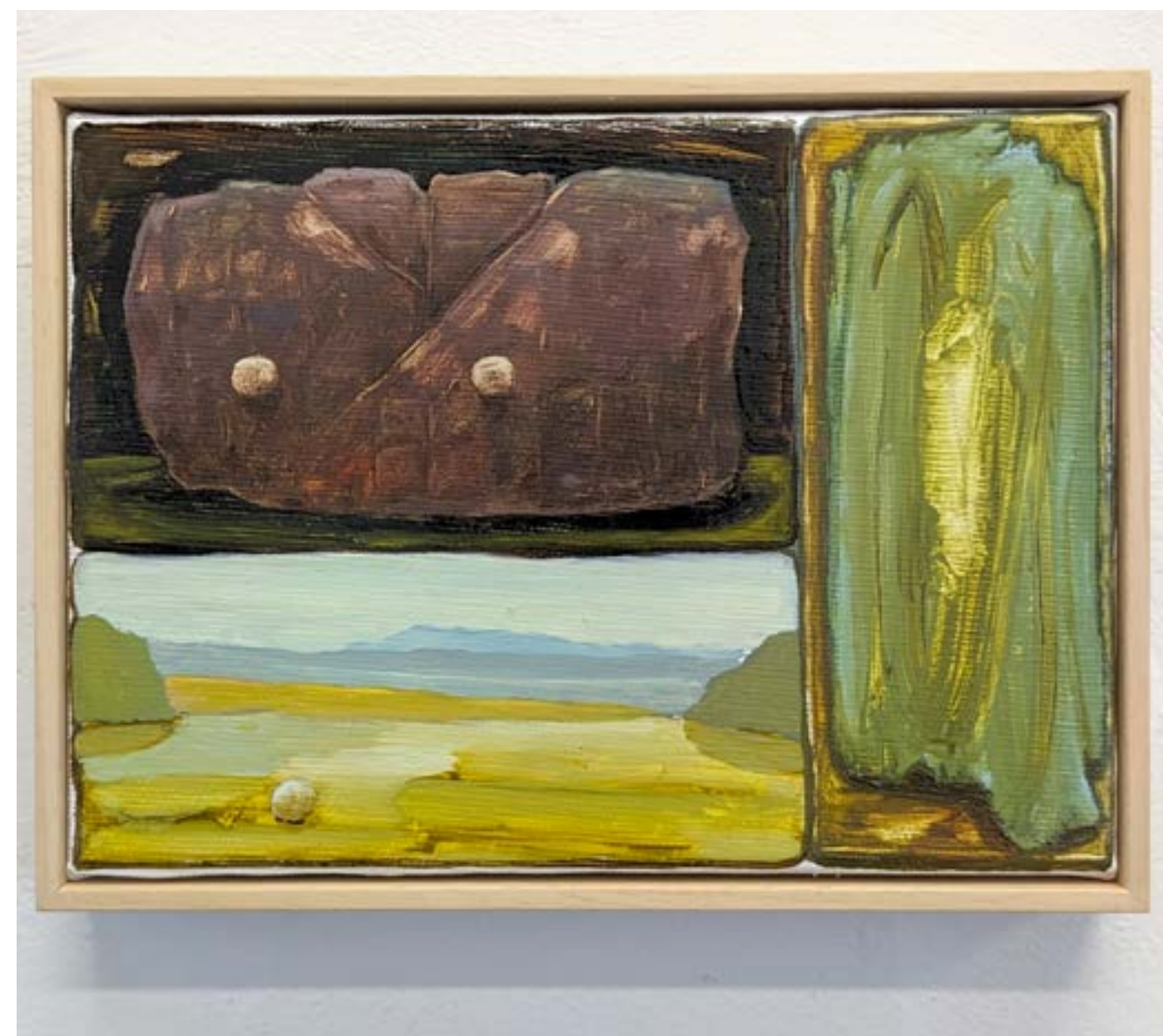
Songe-creux 7, 2023 huile sur toile, 15x20cm