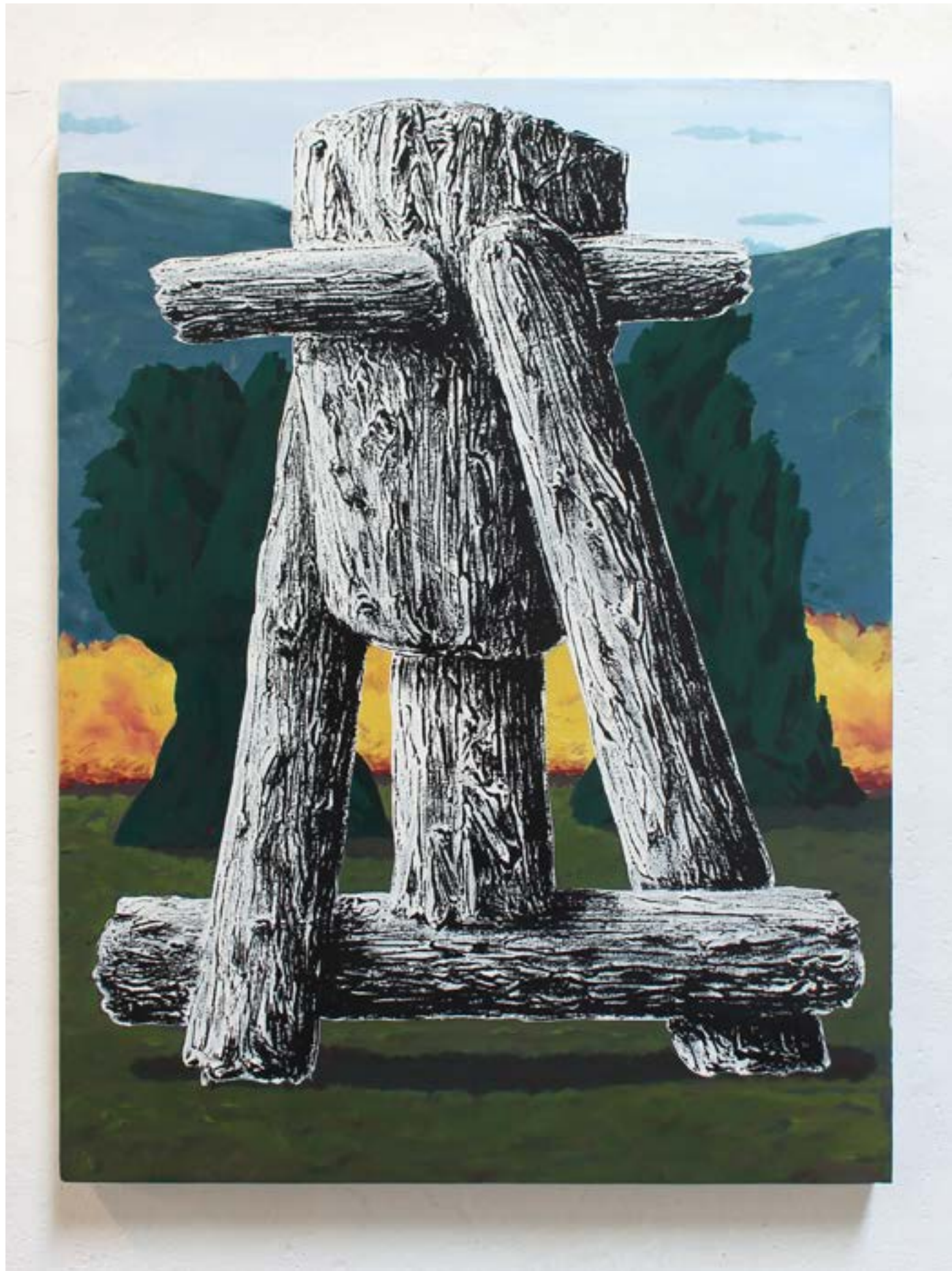
Demain, le toit , 2021 acrylique et huile sur toile, 61,5x45cm