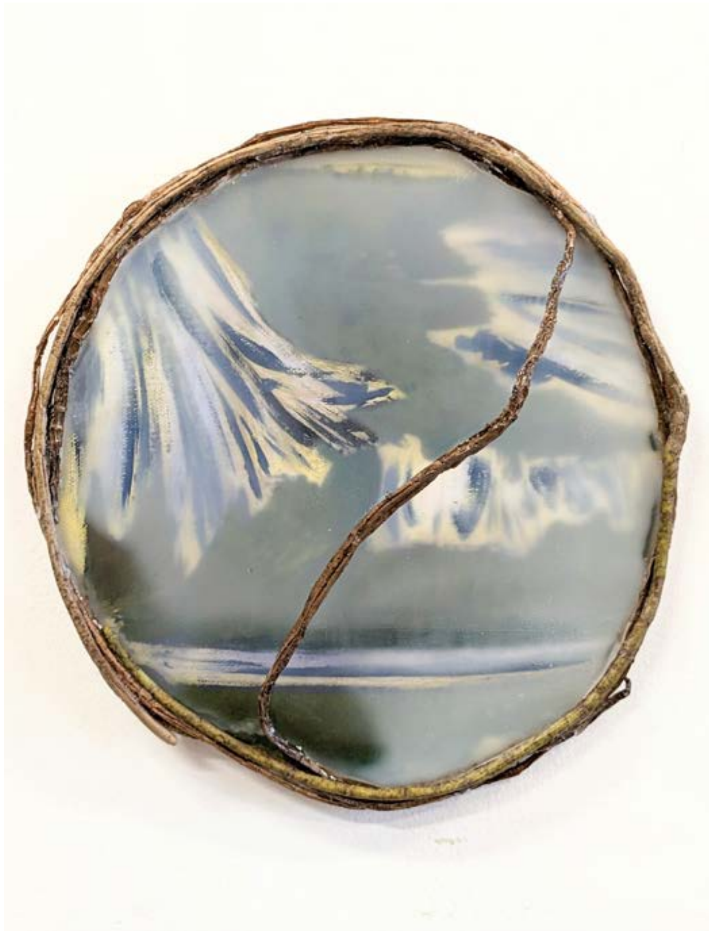
Mon lieu primaire , 2022 huile, cire et résine sur toile, racine, bois, 24cm de diamètre