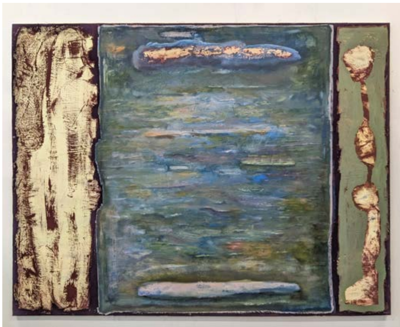
Entre moi et moi, une passerelle #1, 2023 huile et acrylique sur toile, 110x146cm