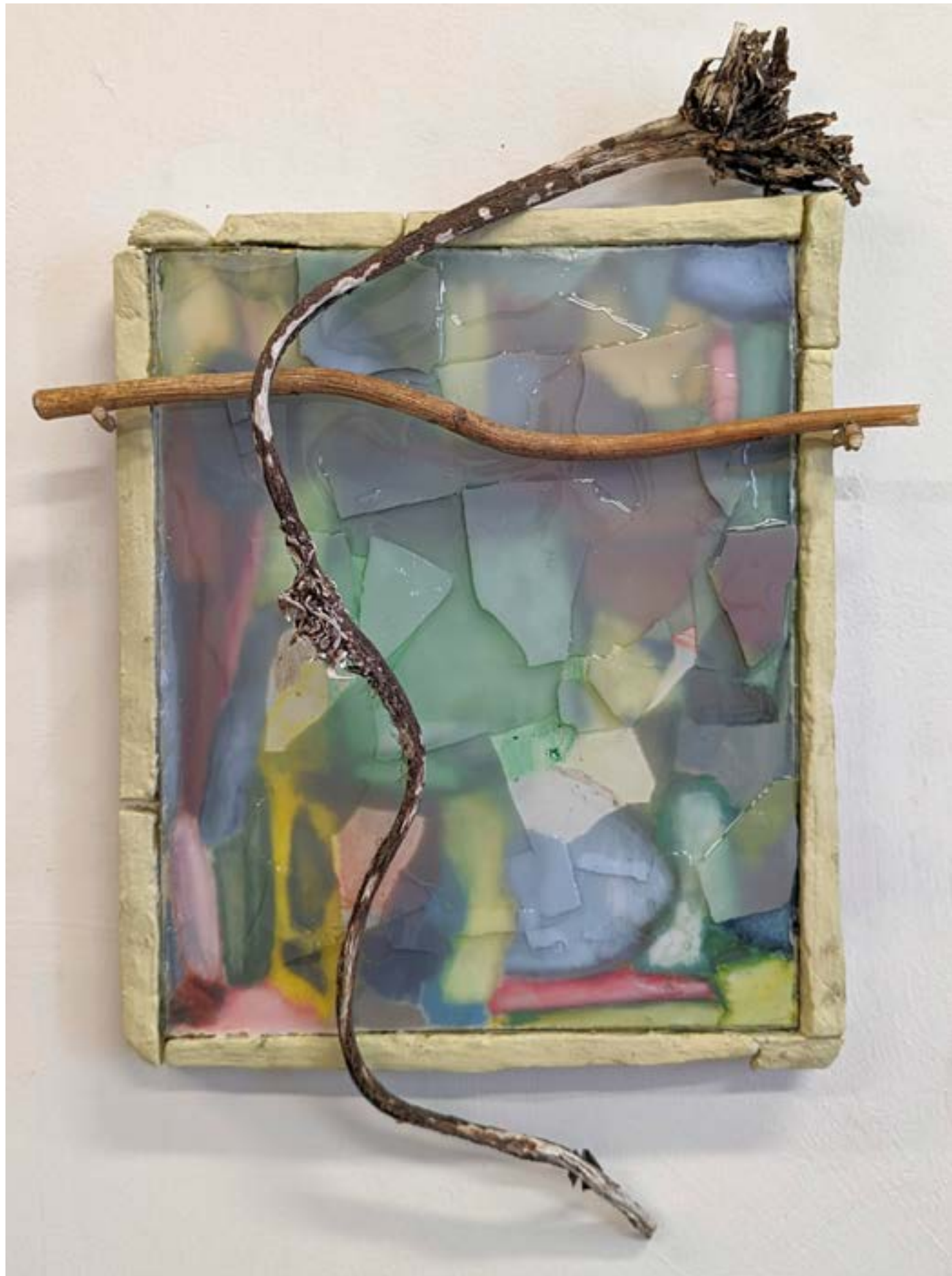
Capioun (peau qui sert de bâche pour protéger de l'eau), 2022 huile, cire, résine sur toile, pâte à carton, bois, algue, 42x30cm print