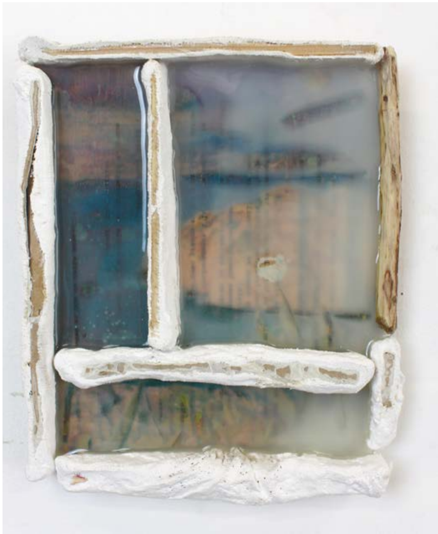
Escafo (fentre entre deux pièces de bois), 2022 impression jet d'encre, cire, résine, bois, plâtre sur bois, 25x19cm