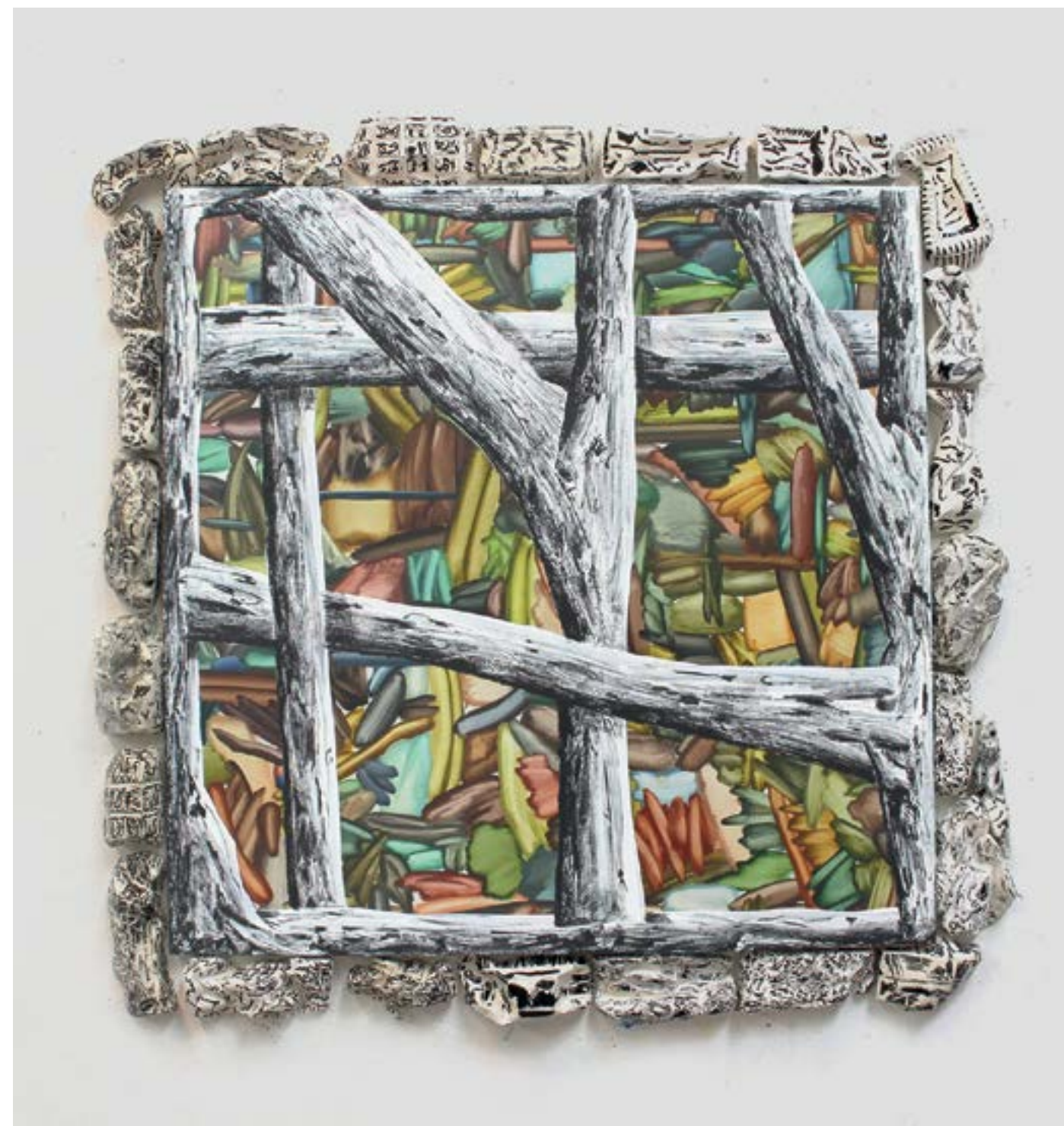
Au calme, 2020 huile, acrylique sur toile cirée sur toile, plâtre, 125x125cm