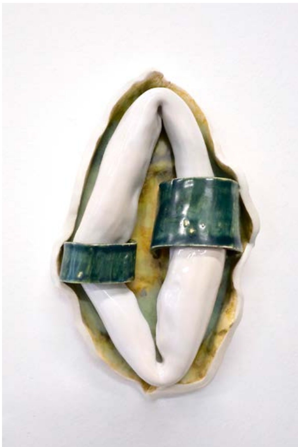
Estrachano 3 (se dit des noix qui ne se détachent pas facilement de leur coque), 2023 céramique, 23x14x6cm