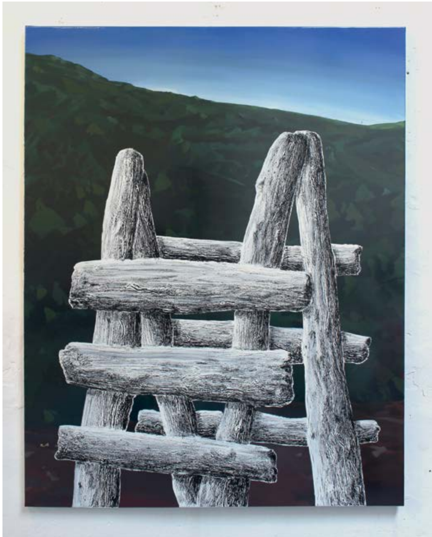
L'échappée , 2020 gesso et huile sur toile cirée sur toile, 146x114cm