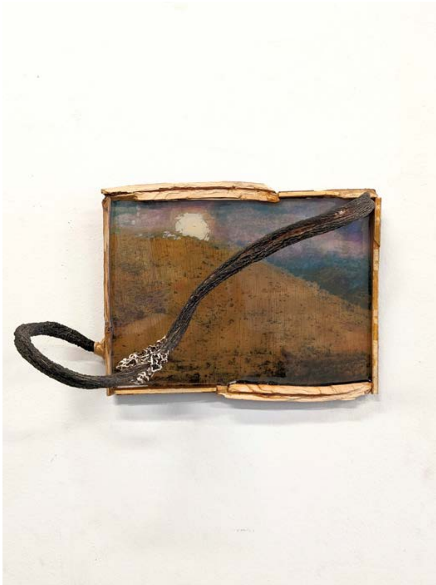
Camp à Amzi, 2022 impression laser, bois, acrylique, résine sur bois, 16x25cm