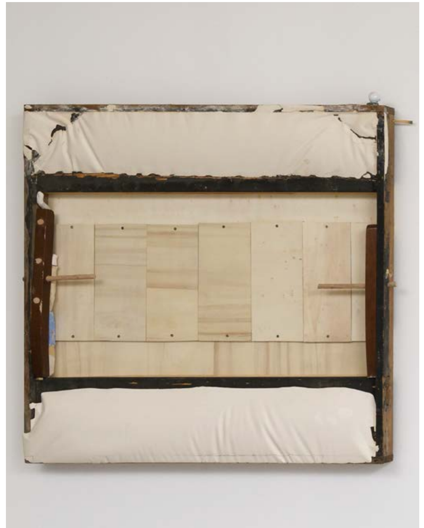
Péril , 2023 plâtre, bois, céramique, 120x120cm