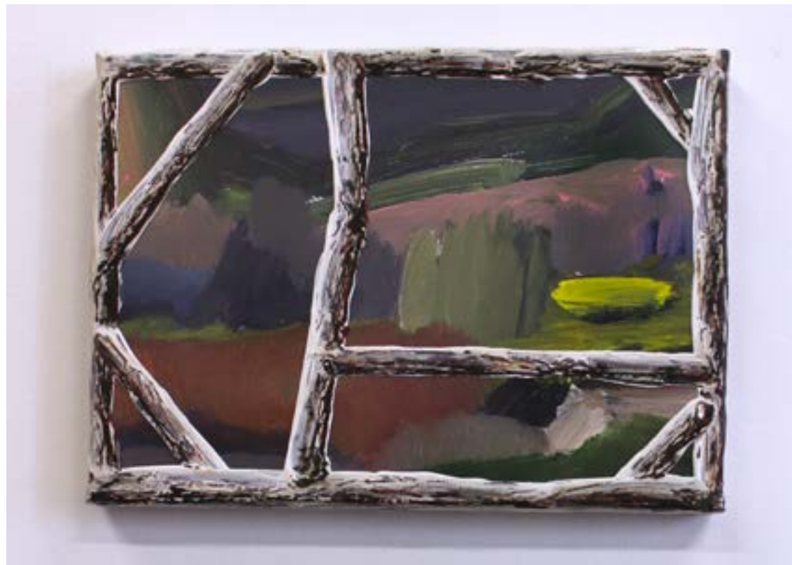
Nature-Peinture 2, 2020 huile,acrylique,toile cirée transparente sur toile, 24x18cm