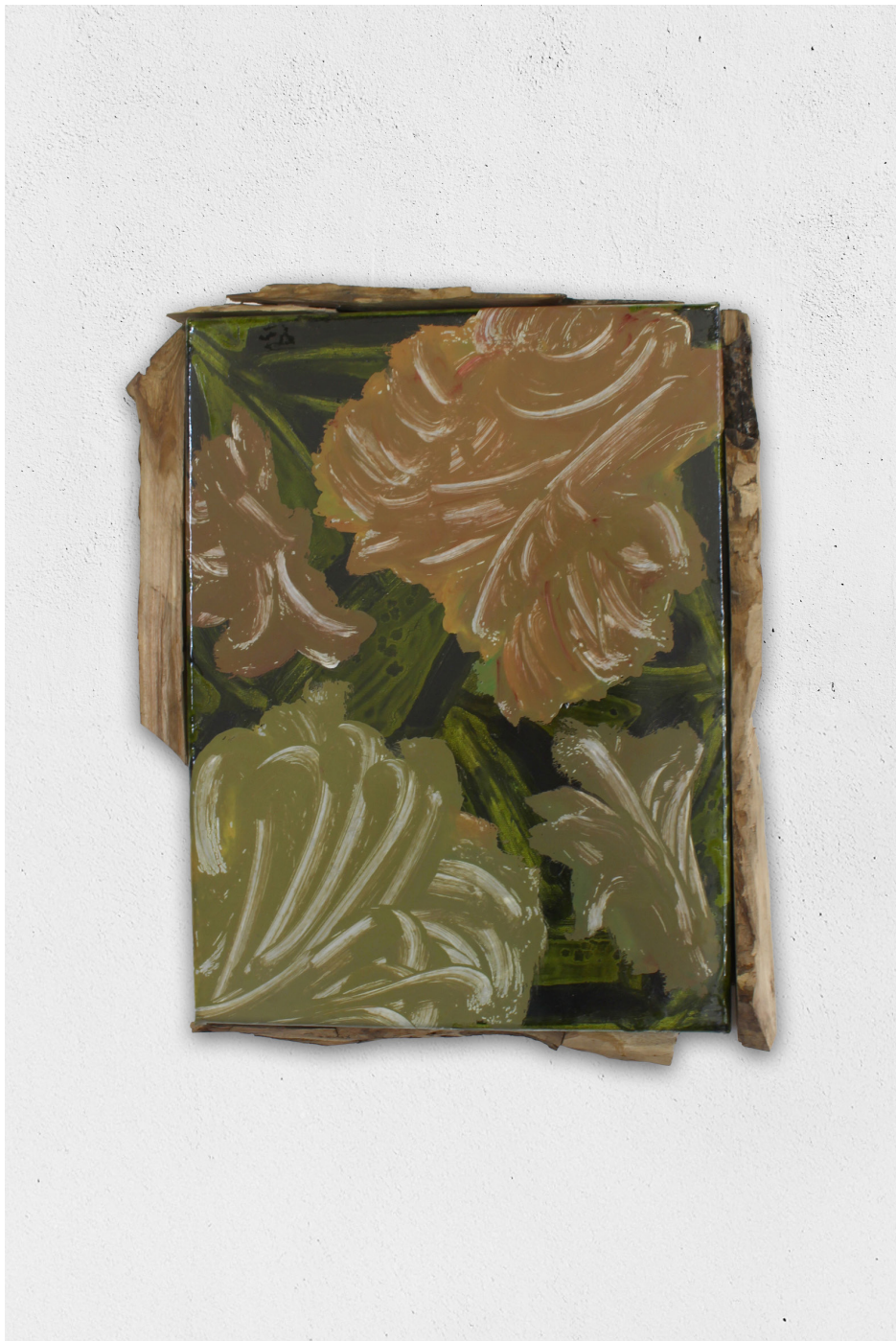
Agaracha (Laisser reposer une terre), 2022 acrylique, huile, bois, toile cirée transparente sur toile, 29x21cm