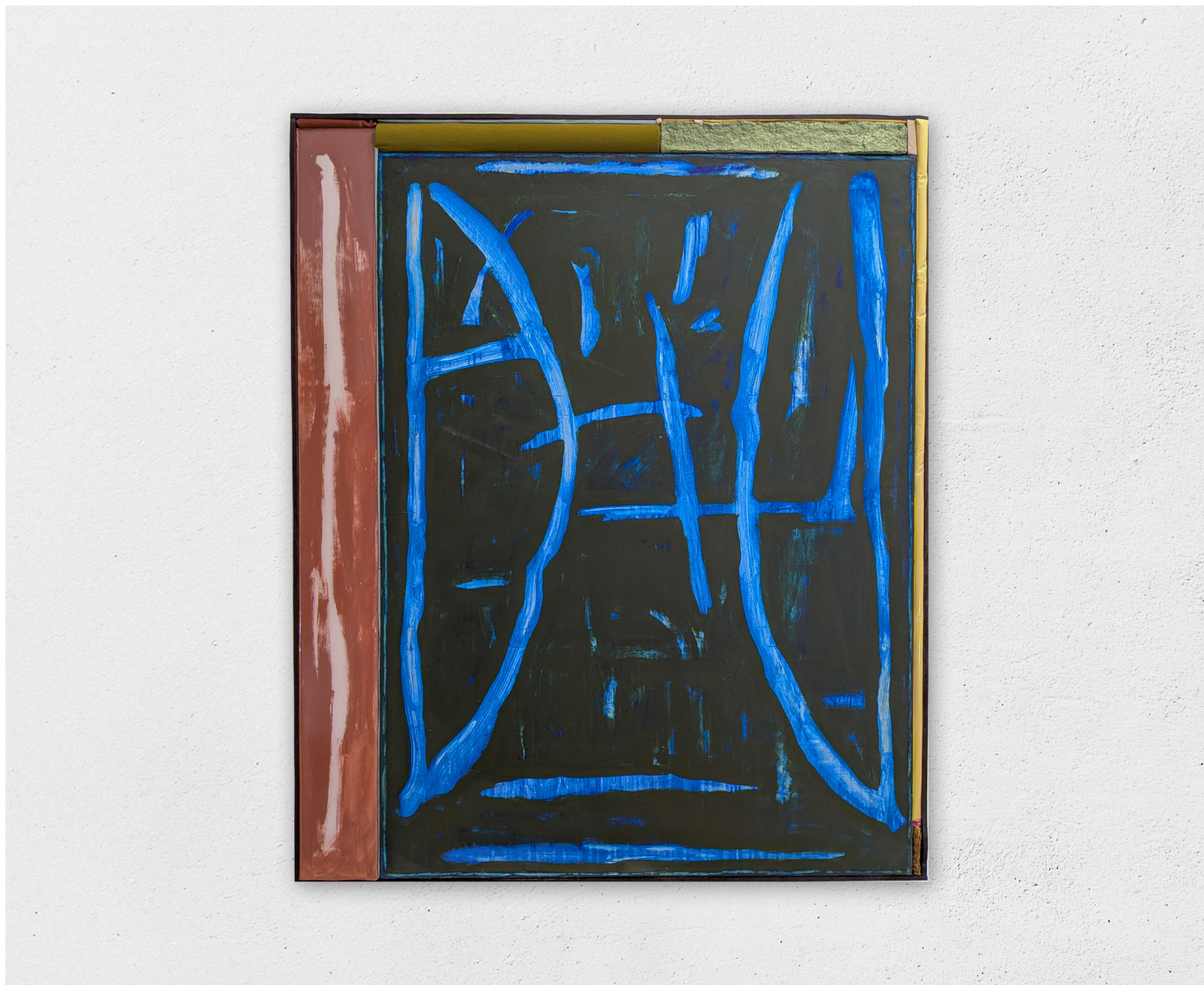
Prières et cris sourds, 2026 peinture, toile, bois, résine, textile, pâte à carton, papier, céramique, 159x131cm