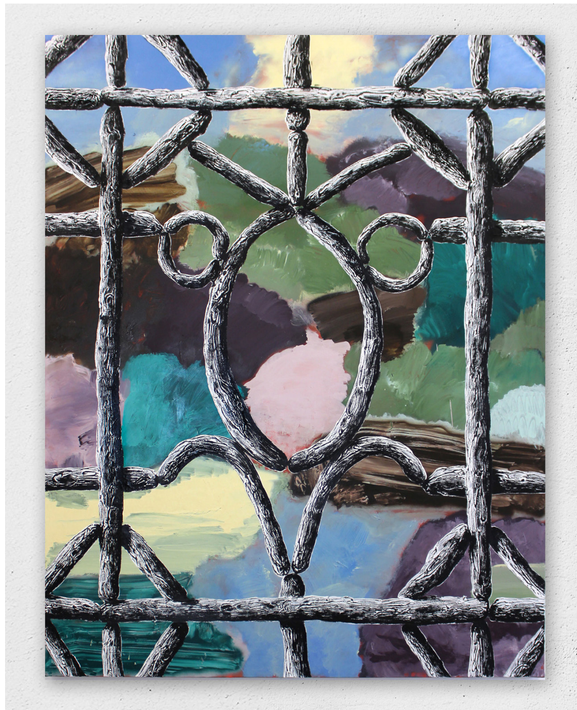
Gasai (le ramage des oiseaux), 2022 acrylique et huile sur toile, 146x114cm (stock atelier).jpg