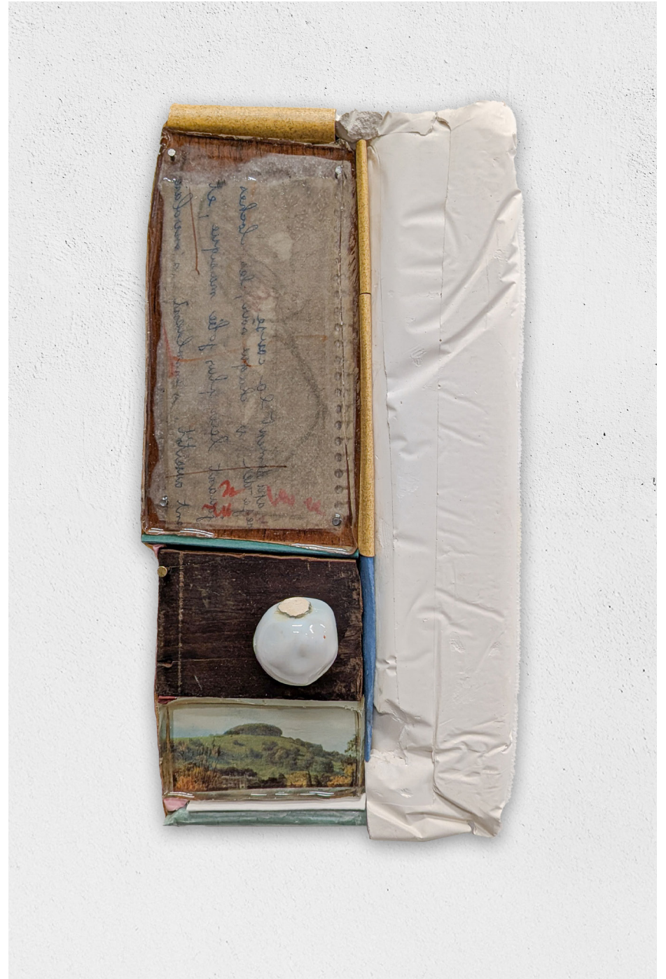
La nuit ne m'attend plus, 2026 plâtre, papier, photographie, bois, résine, céramique, 23x12cm