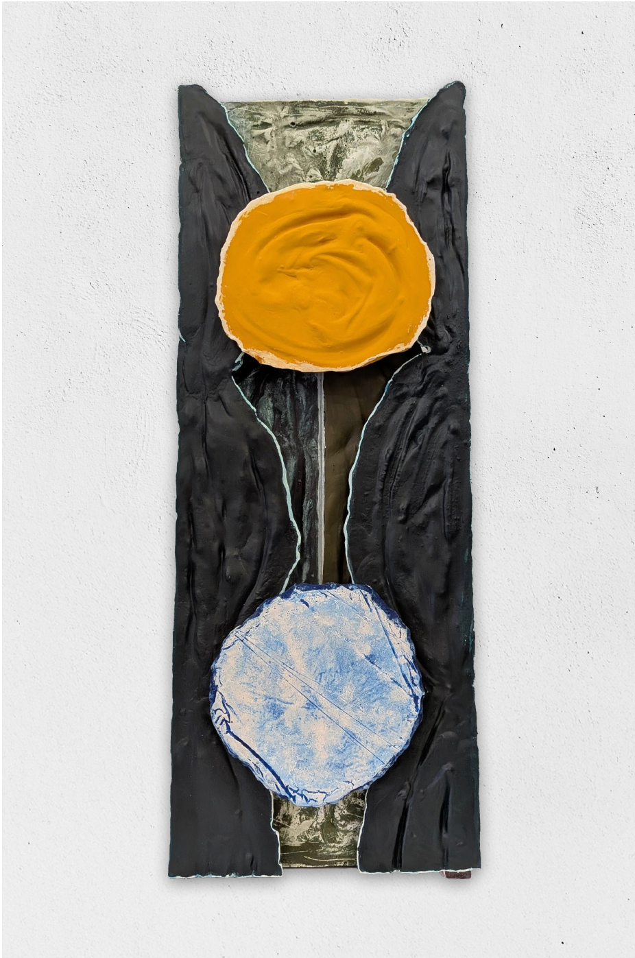
Une pensée pour là haut, 2026 pigment sur plâtre, 66x25x11cm