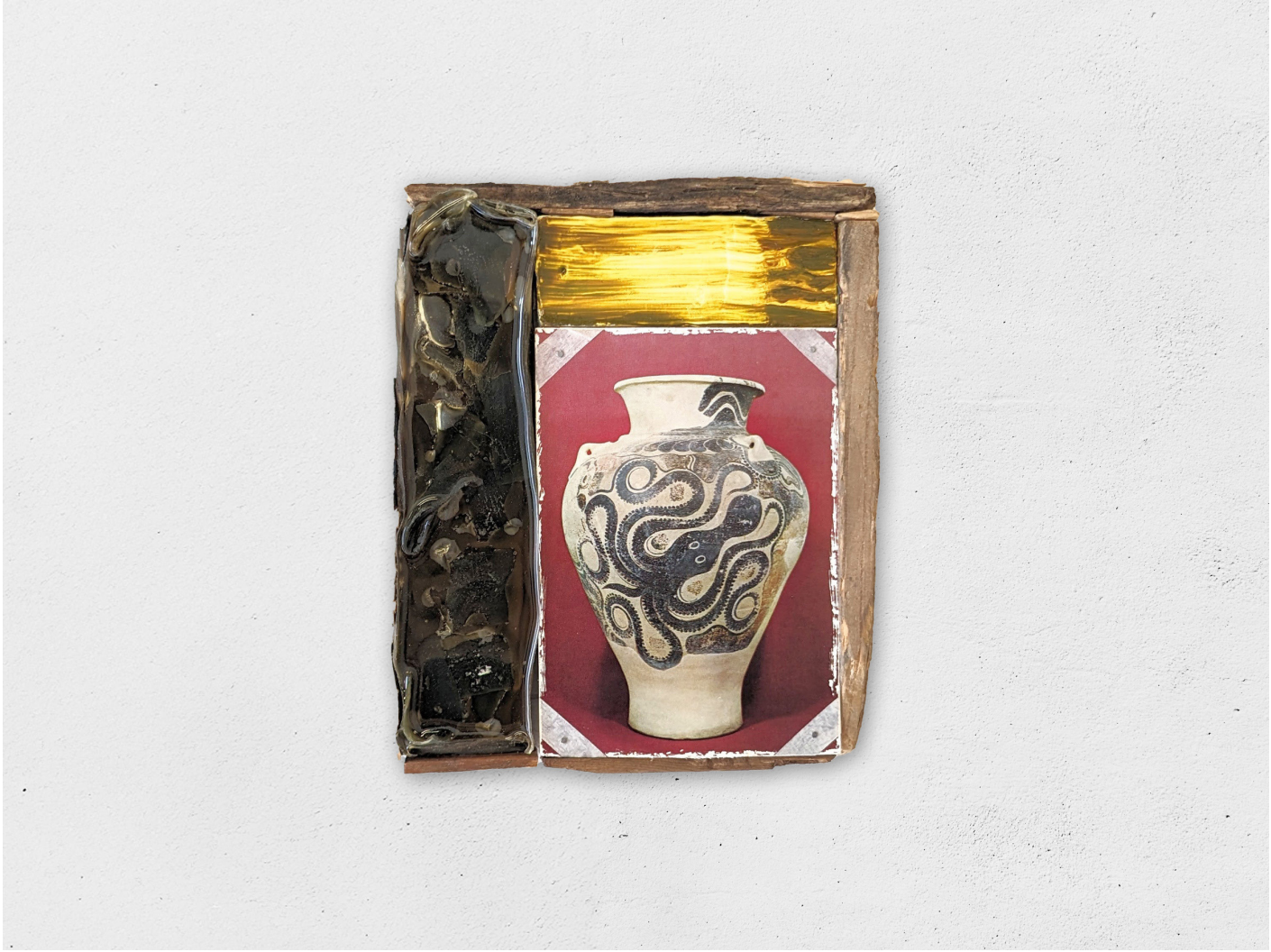
Gestalt 7, 2024 bois, huile, cire, résine, carte postale, 24x18cm (collection Elie)