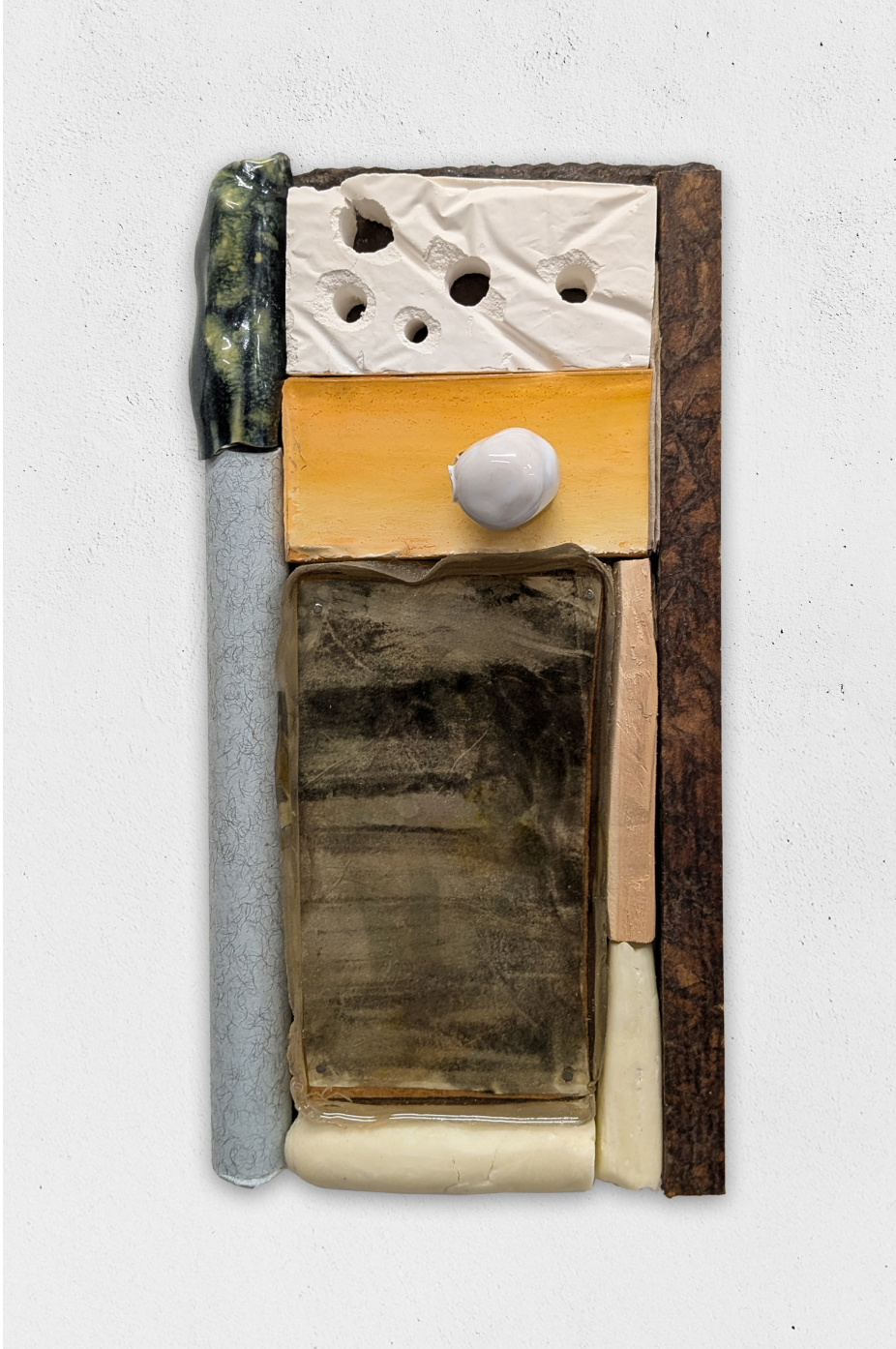
Vouloir tout et ne rien demander, 2026 bois, céramique, papier, résine, plâtre, peinture, 21x11cm