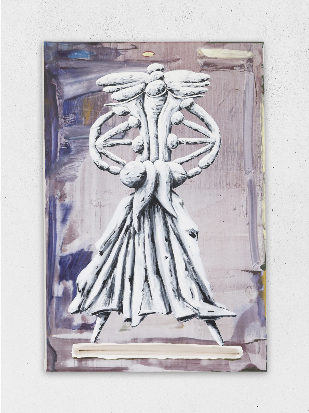
Esfloura (faire tomber les fleurs d'un arbre fruitier), 2023 acrylique et huile sur toile, 195x130cm