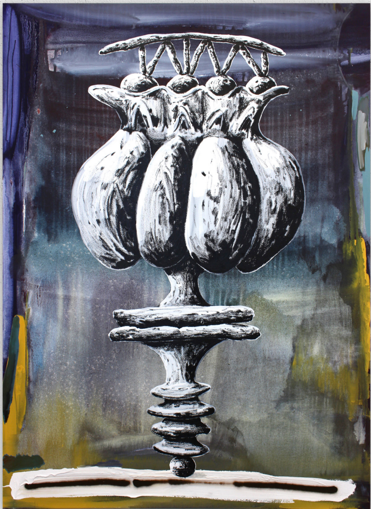
Peiroulet (bulles dues aux gouttes de pluies sur les flaques d'eau), 2023 acrylique et huile sur toile, 150x110cm (vendu)