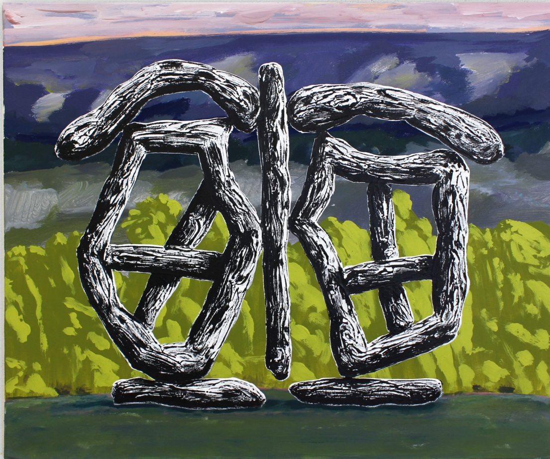
Besvère (voir double), 2022 acrylique et huile sur toile, 50X65cm (click ten)