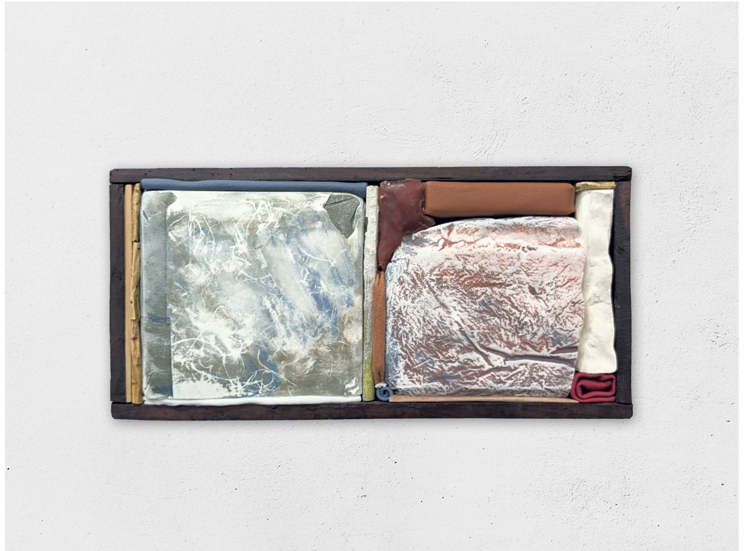
Gestalt 22, 2025 papier, cire, bois, végétaux, cuir, plâtre, pigment, 16x28cm (collection Patrice Hardy)