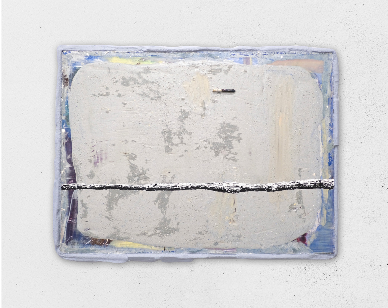
Asuèi (horizon), 2023 acrylique, huile, carton, plâtre, ciment sur toile, 64x85cm