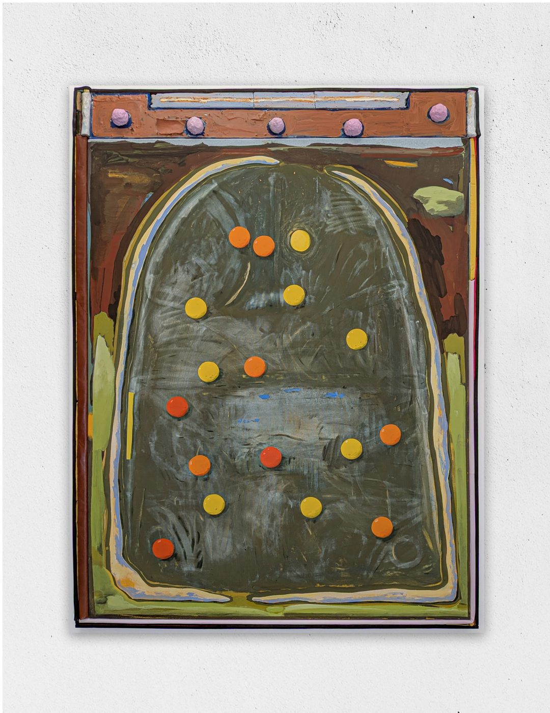
Pour que le bal ai lieu toujours, 2026 peinture, toile, céramique, bois, textile, papier, résine, pâte à carton, plâtre, 174x127cm