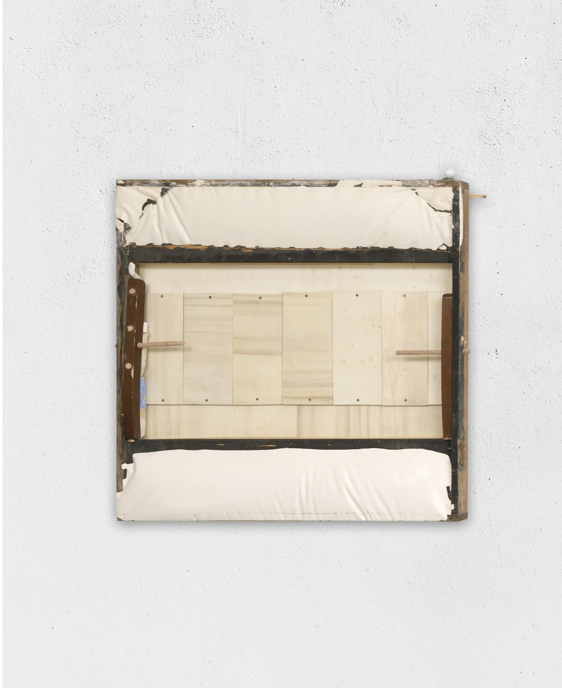
Péril, 2023 plâtre, bois, céramique, 120x120cm (cut)