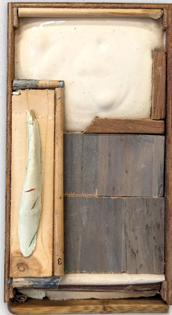
Gestalt 16, 2024 bois, plâtre, acrylique, papier