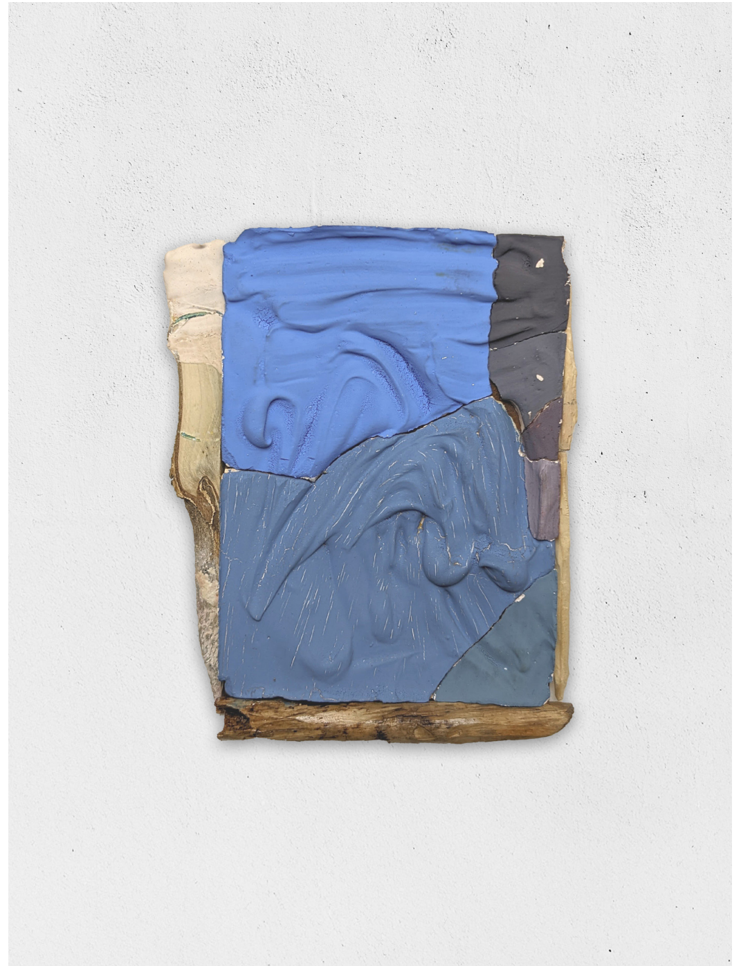
Egotoco (ombre qui s'avancant sur un rocher sert de montre solaire aux paysans), 2021 plâtre, bois, binder, gesso pigmenté sur panneau de bois, 24x19cm