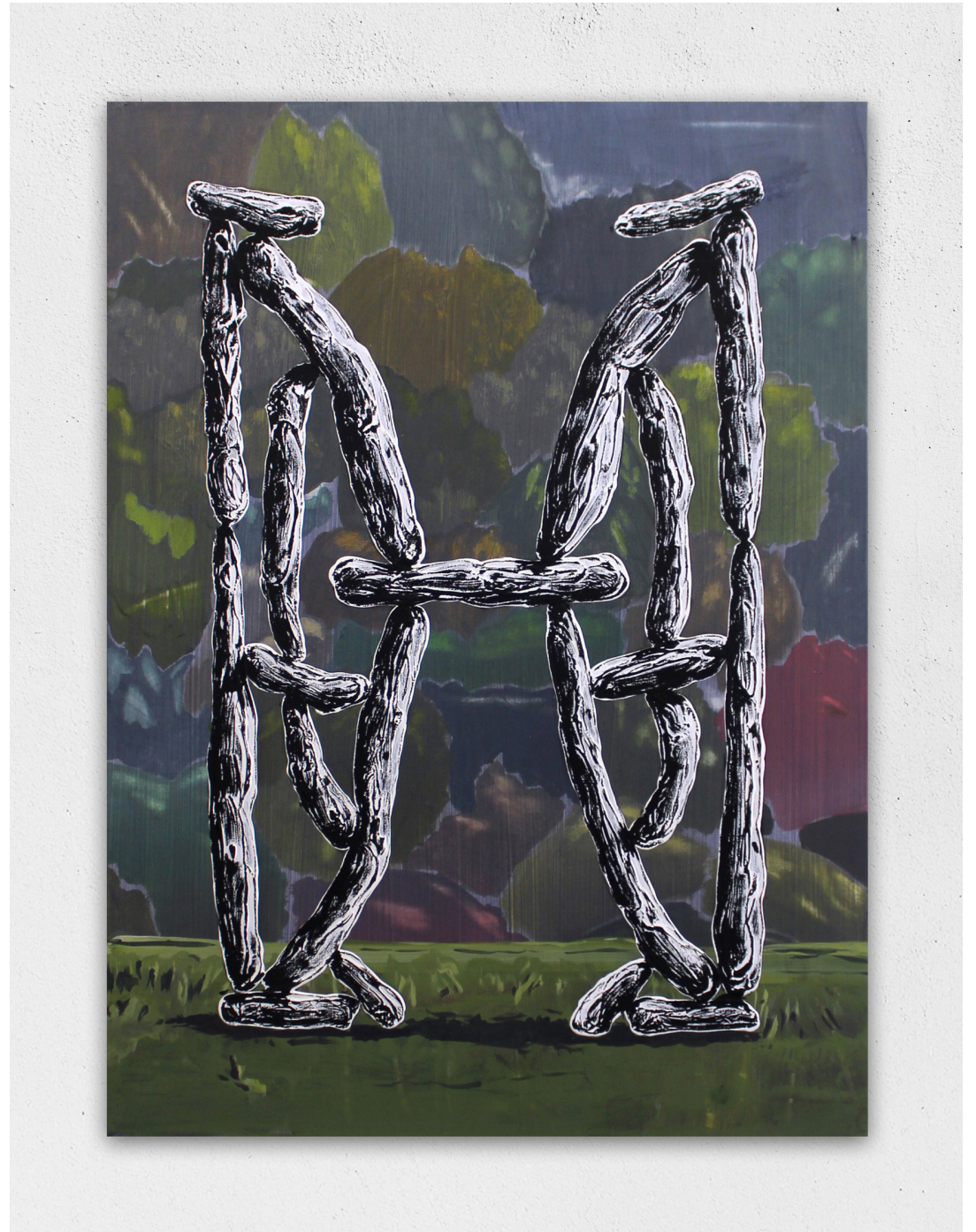
A bellei doues (Par deux) 2022 acrylique et huile sur toile, 81x60cm 2300€ (stock atelier)