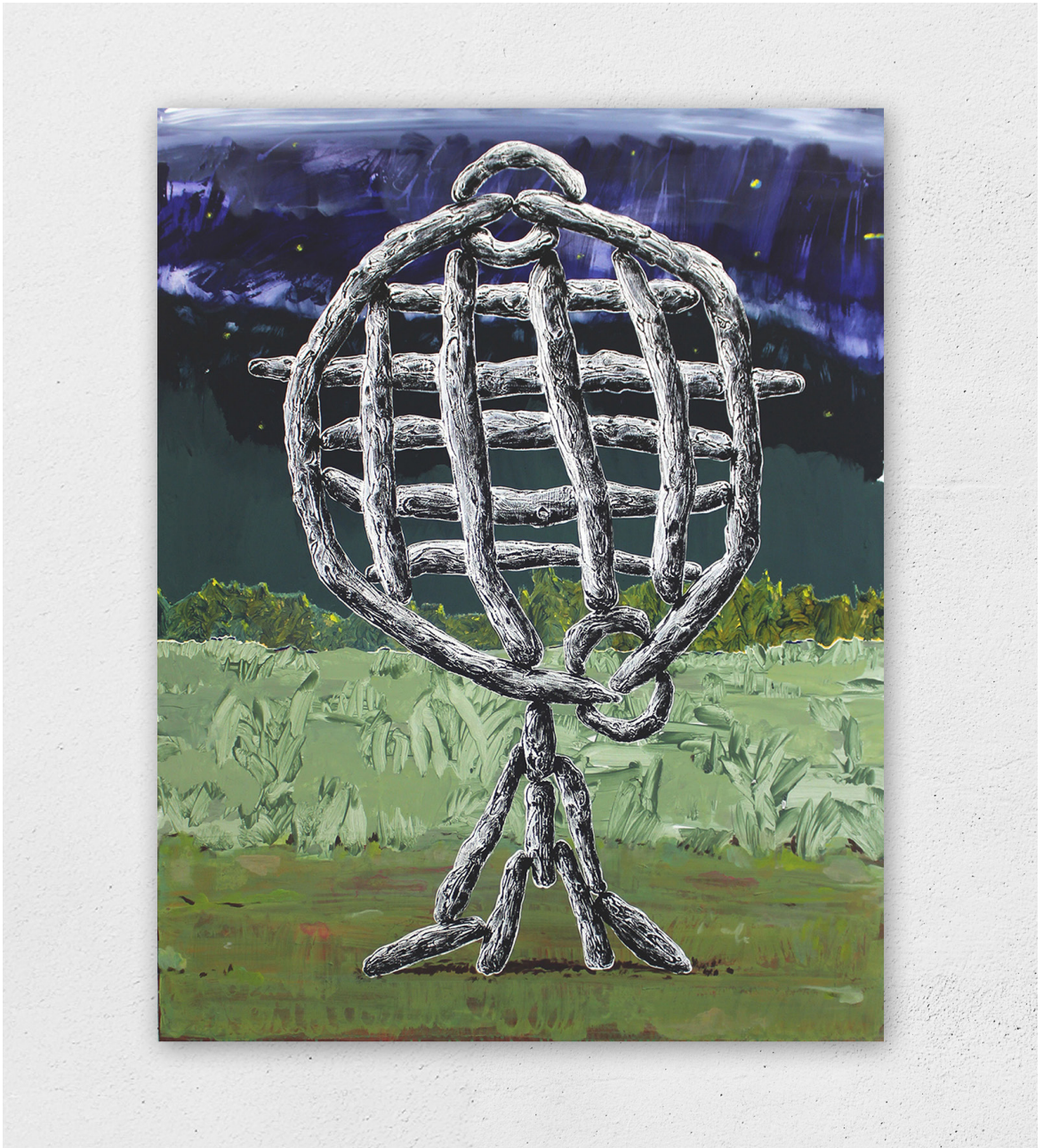
Coucho-mousco (l'attrape mouche), 2022 acrylique et huile sur toile, 146x114cm