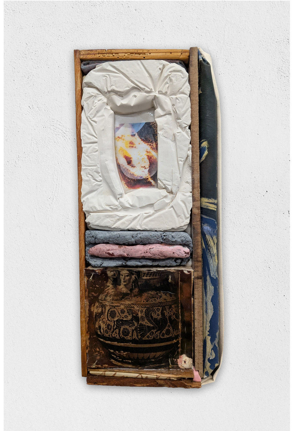
C'est l'erreur insistante qui l'emporte, 2026 papier, photo, cire, résine, peinture, bois, toile, 34x15cm