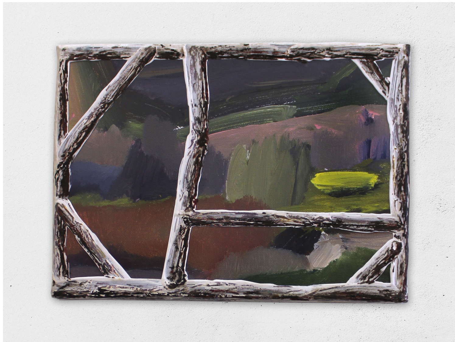
Nature-Peinture 2, 2020

huile, acrylique, toile cirée transparente sur toile, 18x24cm 1000€ (stock atelier)