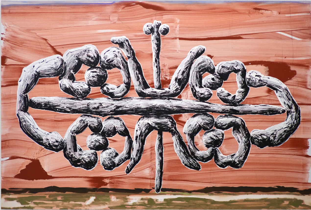
Besala (creuser des canaux pour arroser), 2023 acrylique et huile sur toile, 195x130cm (vendu)