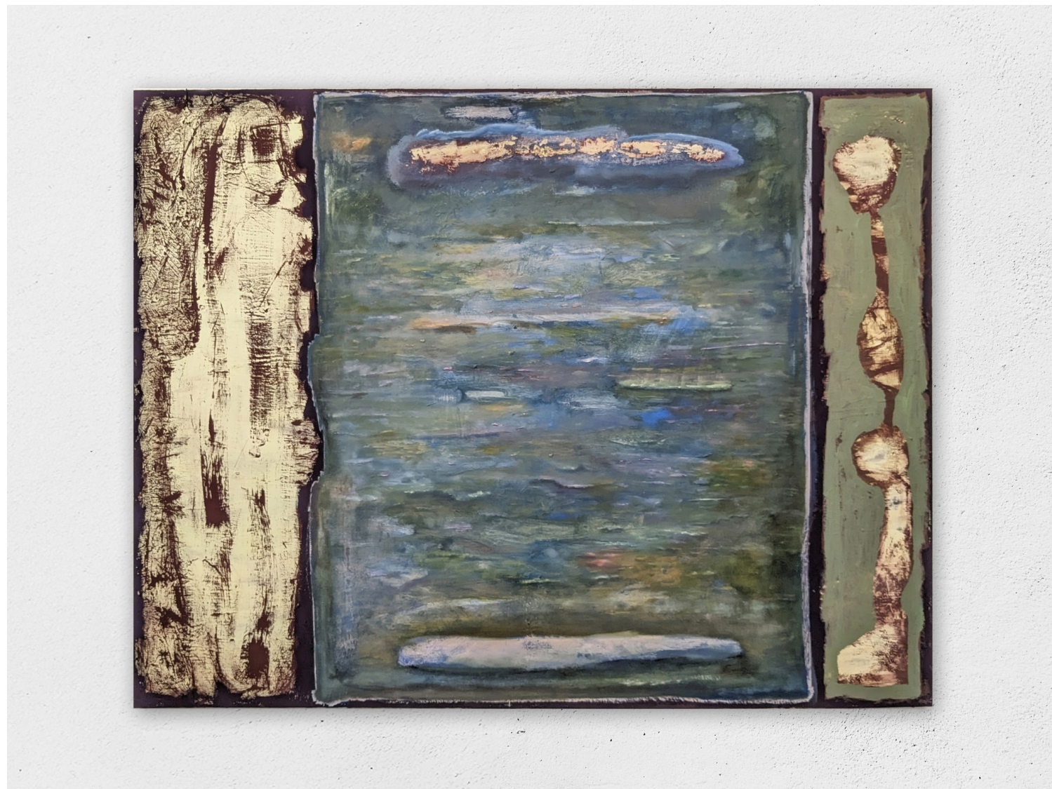
Entre moi et moi, une passerelle #1, 2023 huile et acrylique sur toile, 110x146cm