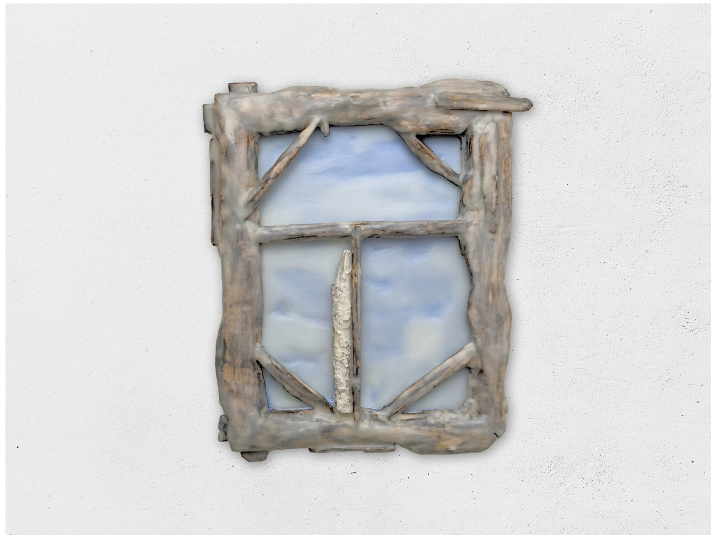
Ambiance poutargue dans la cabane, 2022

huile, acrylique, cire, bois sur bois, 29x25cm print (cach)