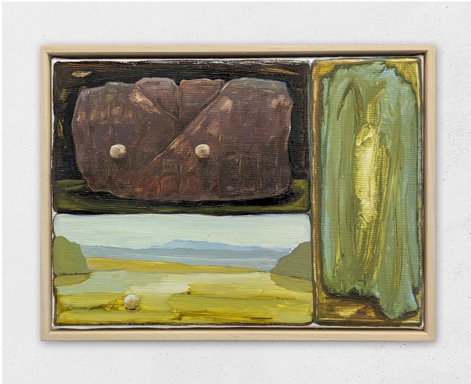
Songe-creux 7, 2023 huile sur toile, 15x20cm